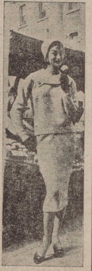
Las que aún no han cumplido sus 17 años...