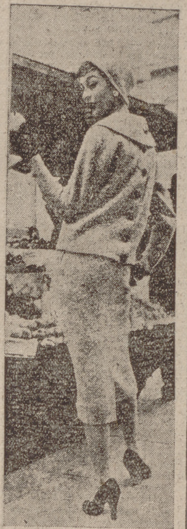
Paris.—La Escuela de Maniquies...

Las españolas son lindas, pero demasiado gordas, y le tienen miedo a la gimnasia