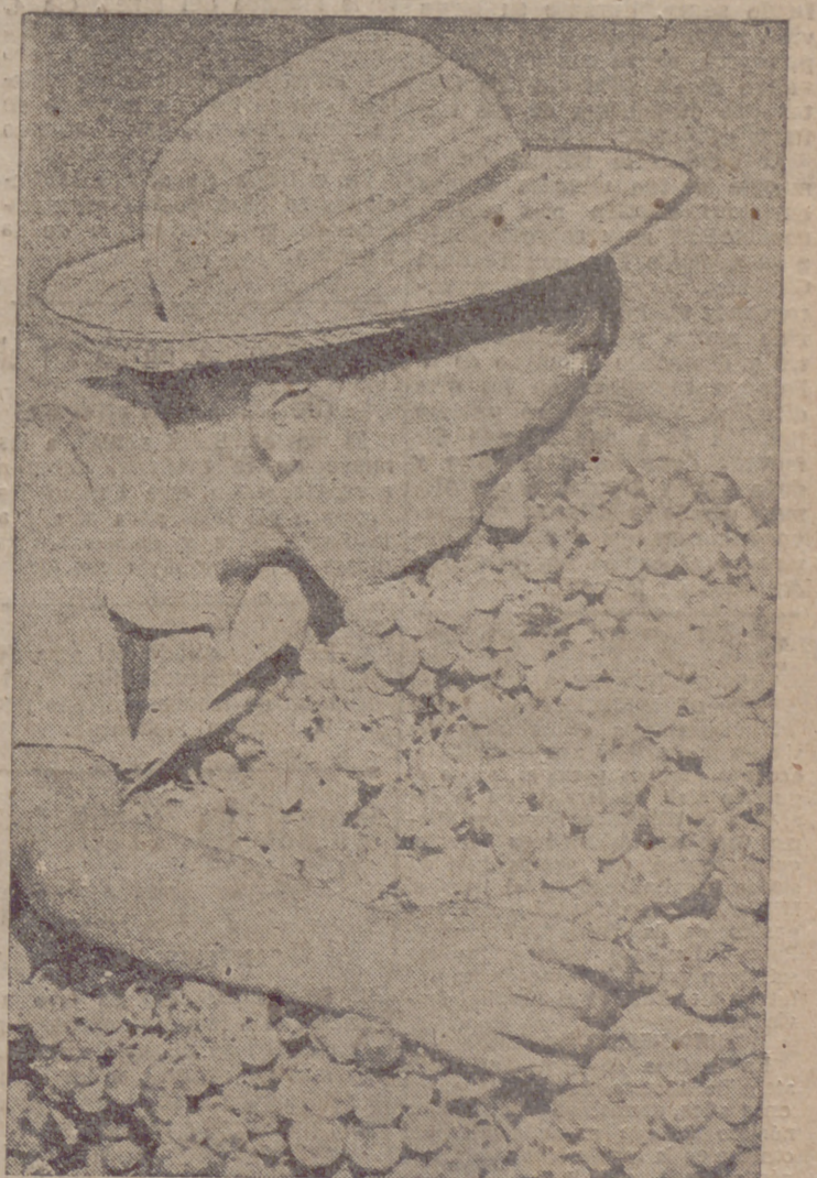
El chaval quiere abrazar el gran racimo y terminar con él de un solo bocado. Pero este racimo extraordinario, que es como una sabrosa imagen del otoño, se resistirá al pequeño aconsejándole calladamente que vaya por partes, es decir, que intente dar fin a este vino en potencia poco a poco, uva por uva... Es el otoño mismo reflejado en el racimo y en el que las uvas son como las cuentas del gran rosario de tres meses que hace unos días hemos inaugurado y que no podremos clausurar, como el niño del racimo, de un solo bocado. Al invierno hay que llevar paso a paso, sin demasiada precipitación; y al invierno llegaremos con la última uva.