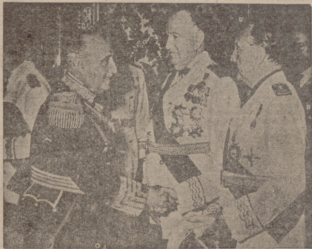
En el XVIII aniversario de su exaltación a la más alta magistratura de la Patria, S. E. el Jefe del Estado fue cumplimentado en el Palacio de Oriente por el Gobierno en pleno. En nuestra fotografía aparece el Generalísimo en el momento de saludar al ministro secretario general del Movimiento, camarada Raimundo Fernández Cuesta.