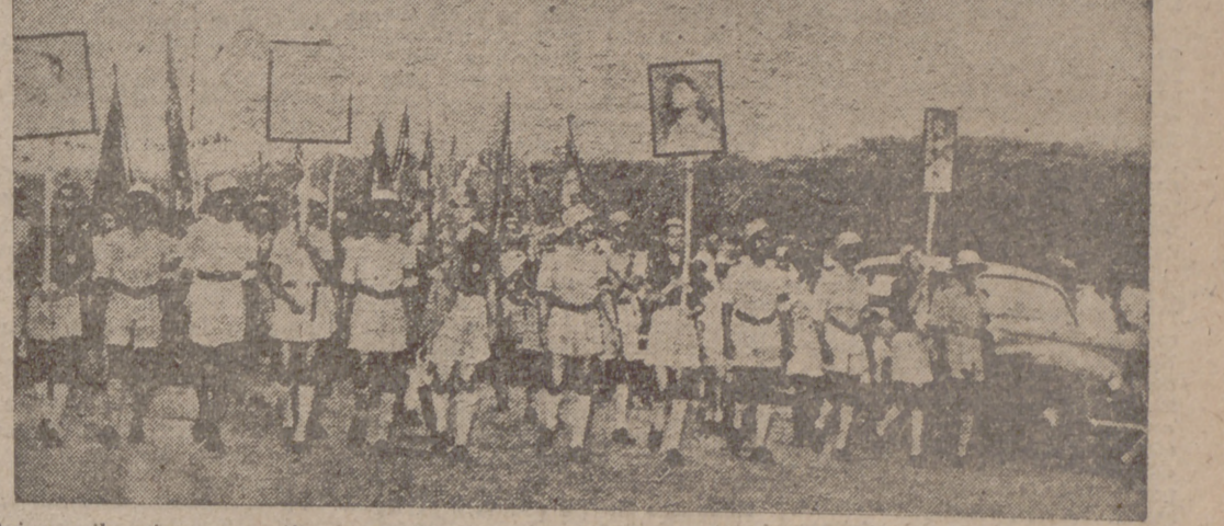
Quince mil nativos se manifiestan en Goa para protestar del intento de ocupación de dicha colonia portuguesa. Los retratos son los de cuatro policiaños muertos en un choque con los hindúes, al invadir éstos Dadra, pequeña localidad del territorio portugués de Damão.

Algunas comunidades indias de Mozambique apoyan a Portugal 7 millones de cigarrillos para los soldados que luchan en Goa