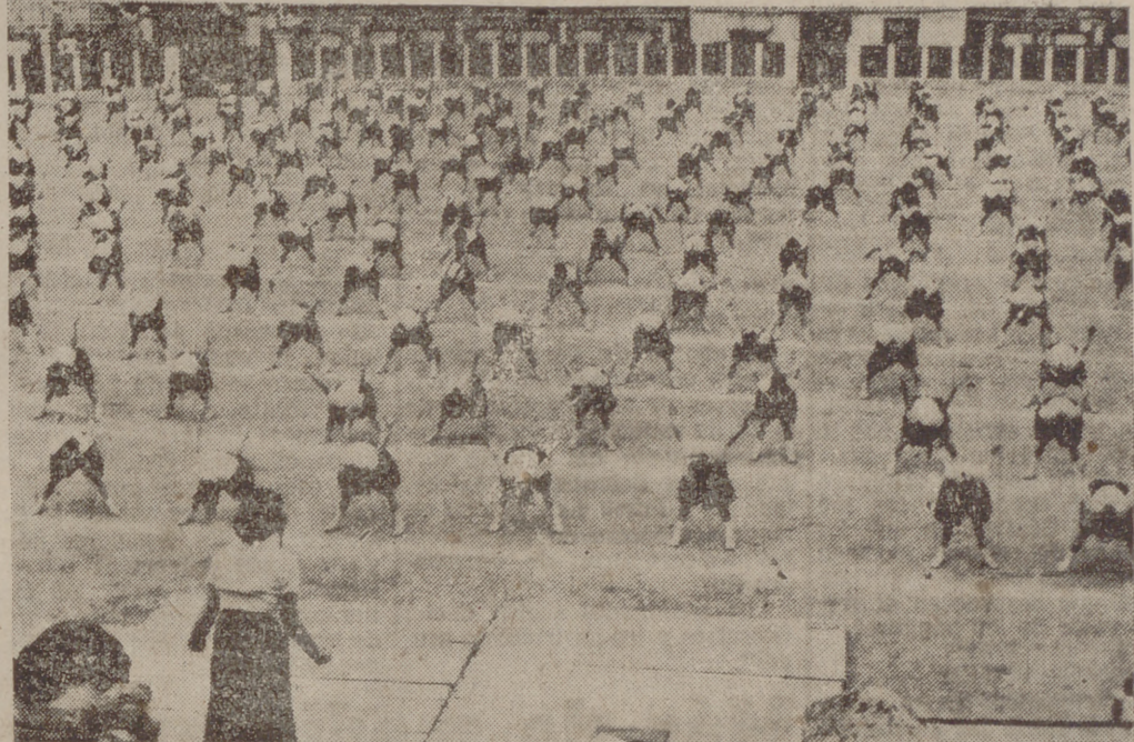
Un momento de la interesante demostración de gimnasia.

Es una lástima que el tiempo, este factor esencial en las reseñas de última hora, nos impida hacer una reseña amplia y detallada sobre el gran festival gimnástico de escolares organizado y preparado por la Sección Femenina.