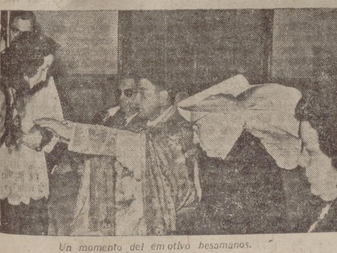
Un momento del emotivo besamanos.