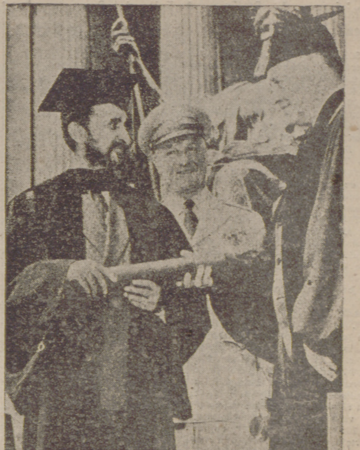
Nueva York.—El rector de la Universidad de Columbia, Grayson Kirk, entrega al emperador de Etiopía, Haile Selassie I, el diploma con su nombramiento de Doctor Honoris Causa de la Facultad de Derecho de aquel centro docente, en el curso de una sencilla ceremonia de investidura.