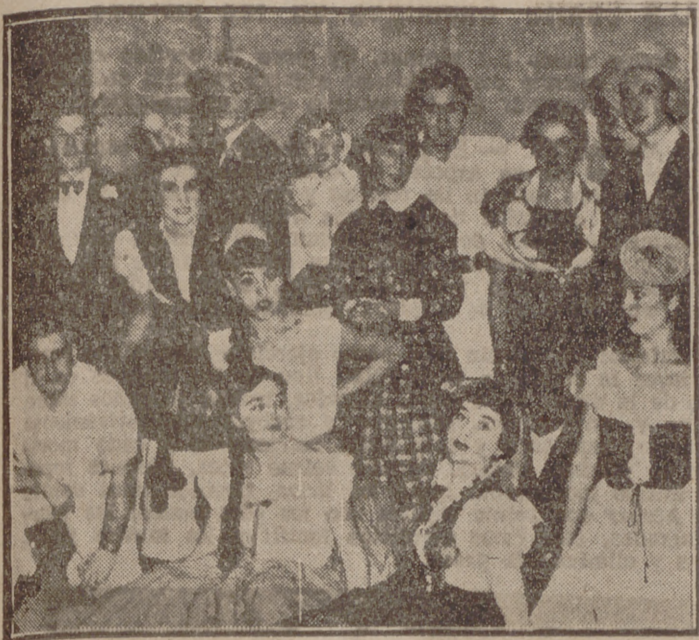
Estudiantes y señoritas que intervinieron en el festival celebrado ayer en Calderón.

Con lleno absoluto en todas las localidades se celebró ayer en Calderón el anunciado festival comico-musical «Duelo al Koch», organizado por los alumnos de 5.º de Medicina a beneficio del Pabellón de Niños Tuberculosos.