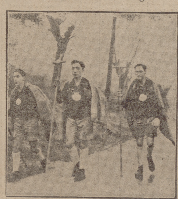
Tres muchachos del Frente de Juventudes de Bilbao han emprendido la peregrinación a pie, por la costa, a Santiago de Compostela, para ganar el Jubileo del Año Santo. El recorrido, de 660 kilómetros, lo harán en 27 etapas.