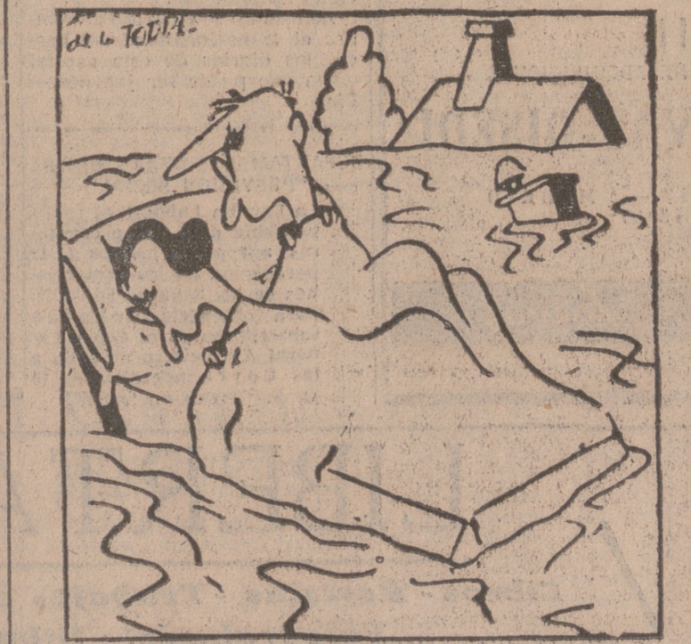
—Despierta, Pepita. El niño ha debido de volver a hacerse pis en la cama...

El niño melancólico, aquel que jamás elabora ni ríe nada, suele ser enjambado y pálido. El soneto, por el contrario, no puede estar quieto y, ¡claro!, el movimiento suele terminar con cristales y demás cosas rompiables.