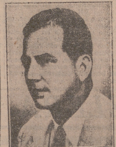
Don Ricardo Arias Espinosa, vicepresidente de la República de Panamá y ministro de Trabajo y Previsión Social, que llegará a Madrid el próximo día 18, invitado por el Gobierno español.