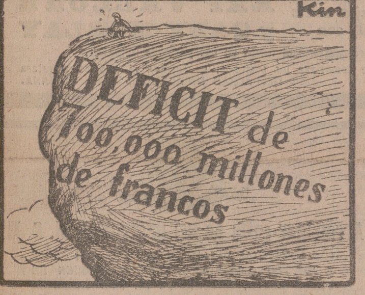
La grandeza que se supone.