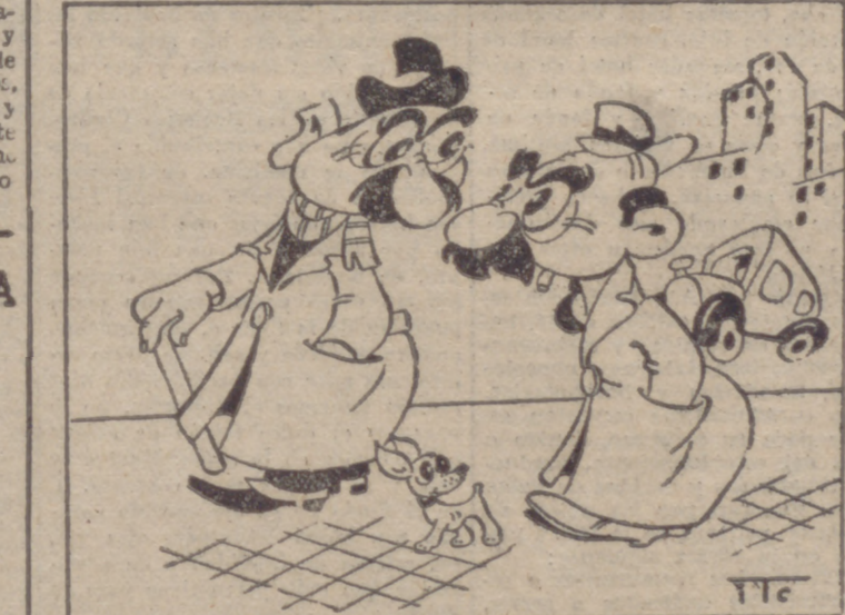
—Yo explicaba antes Algebra en la cátedra; ahora explico "Condiciones y tarifas eléctricas".