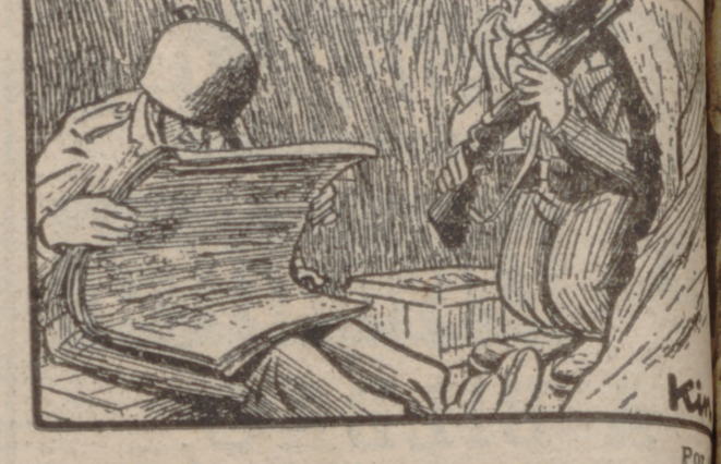
—Malenkov ha dicho que continuará los esfuerzos para mantener la paz. —¡Hombre, ya se ve!