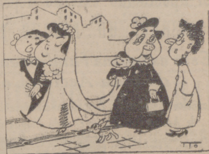
—Es un jugador del Valladolid. —Vaya, un mal partido.