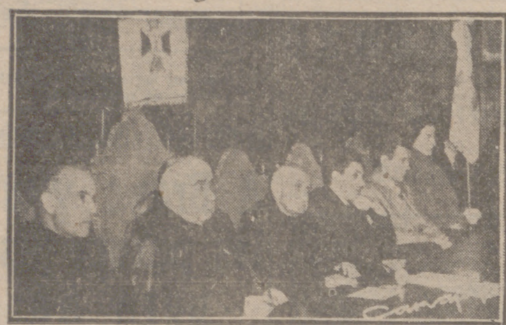
El reverendísimo señor Arzobispo presidiendo el acto de clausura de la Asamblea Diocesana de Acción Católica, celebrada el domingo, a las siete de la tarde, en el Aula Magna.

1) Los que “non querunt quee sunt, sed quee Iesu Christi” se gozan del bien que se hace, sea quien sea el que lo hace. 2) Por tanto, no atacan a ningún árbol que en el huerto de la Diocesis da frutos con la bendición del Prelado Diocesano. 3) No aumenta las palomas de