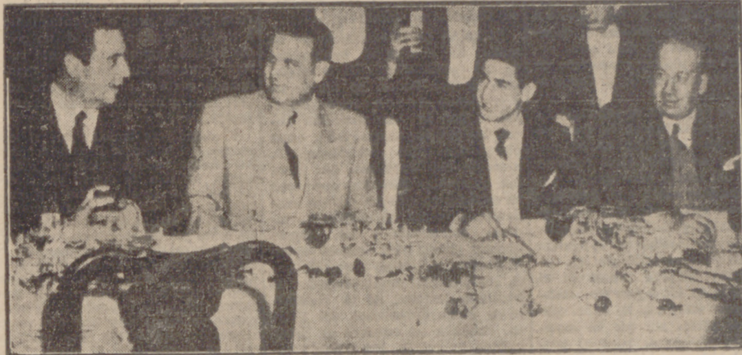
El homenajeado con las primeras autoridades en la presidencia del acto