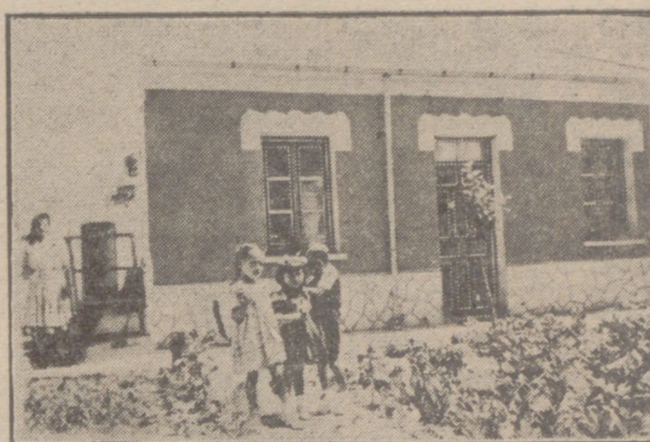
Una casa chalet del Barrio de España.

En la visita que hice al barrio data en la que adquirí la mayor parte de los datos de que me he valido para redactar este conjunto de pequeños capítulos sobre este interesante tema vallisoletano, seguí la margen derecha de la Esqueva canalizada y, siguiendo después por la llamada Bajada del nombre de ese mismo río, fui a dar en las proximidades de uno de los establecimientos situados en una de aquellas casas, denominadas "El Caserío". Es un bar alojado en la planta, para llegar al cual hay que descender un desnivel del terreno algo resbaladizo, como ocurre con frecuencia al producirse algo de lluvia, como había sucedido entonces. En el tincoño fronterizo a la entrada está la barra acotando la esquina y la anaquelera para las botellas forma escaquería, aprovechando así el ángulo. En el otro extremo, haciendo pajeña con la puerta de acceso, jugaban al fútbol muchos parroquianos, pasando la hora del descanso de la tarde. En varias mesas algunos otros se reunían en tertulias. Al fondo se encuentra una puerta de salida interior al patio y a un trozo de huerta que desde allí se descubre.