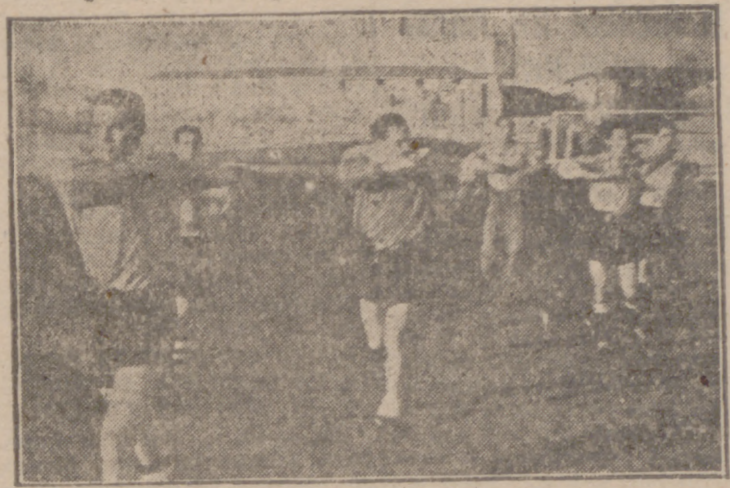
Una fase del ligero entrenamiento realizado por el Santander durante la tarde de ayer en nuestro Estadio.

“Es un partido muy difícil para nosotros, y poco más de un tanteo honroso es lo que podemos esperar”, comentó Ochoa