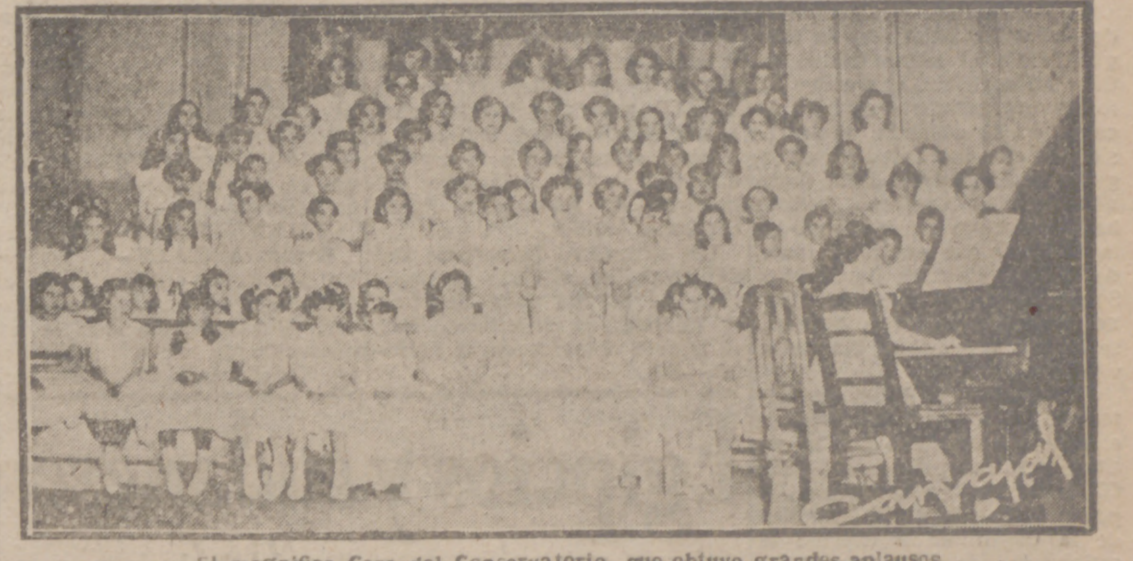
El magnífico Coro del Conservatorio, que obtuvo grandes aplausos

Concierto del Conservatorio, en colaboración con la Orquesta Municipal