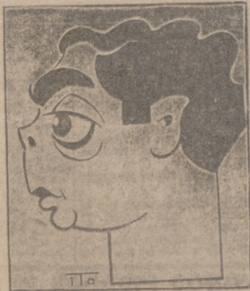
FRANCISCO BOSCH (Caricatura por ITO.)

"Ella cree que no se puede vivir a 10 pesetas la butaca"