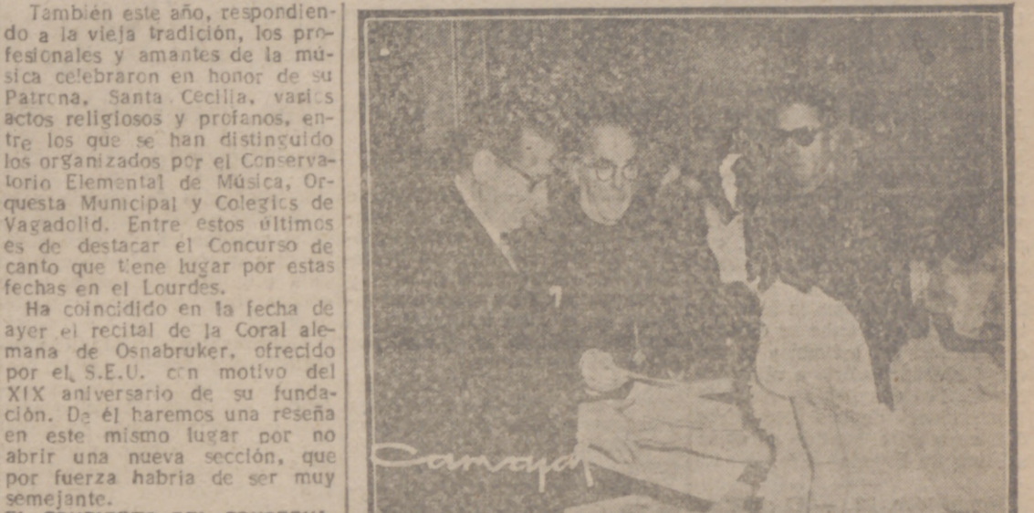
Un momento del reparto de premios.

También este año, respondiendo a la vieja tradición, los profesionales y amantes de la música celebraron en honor de su Patrona, Santa Cecilia, varios actos religiosos y profanos, entre los que se han distinguido los organizados por el Conservatorio Elemental de Música, Orquesta Municipal y Colegio de Valladolid. Entre estos últimos es de destacar el Concurso de canto que tiene lugar por estas fechas en el Lourdes.