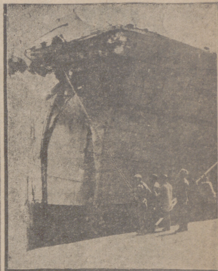
El "Djenne", un paquebote francés, que chocó en el Estrecho de Gibraltar con el "Japara", llega a Marsella por sus propios medios a pesar de todo. No obstante, la fotografía revela claramente el estado en que quedó la popa del buque, completamente destruida en la colisión.