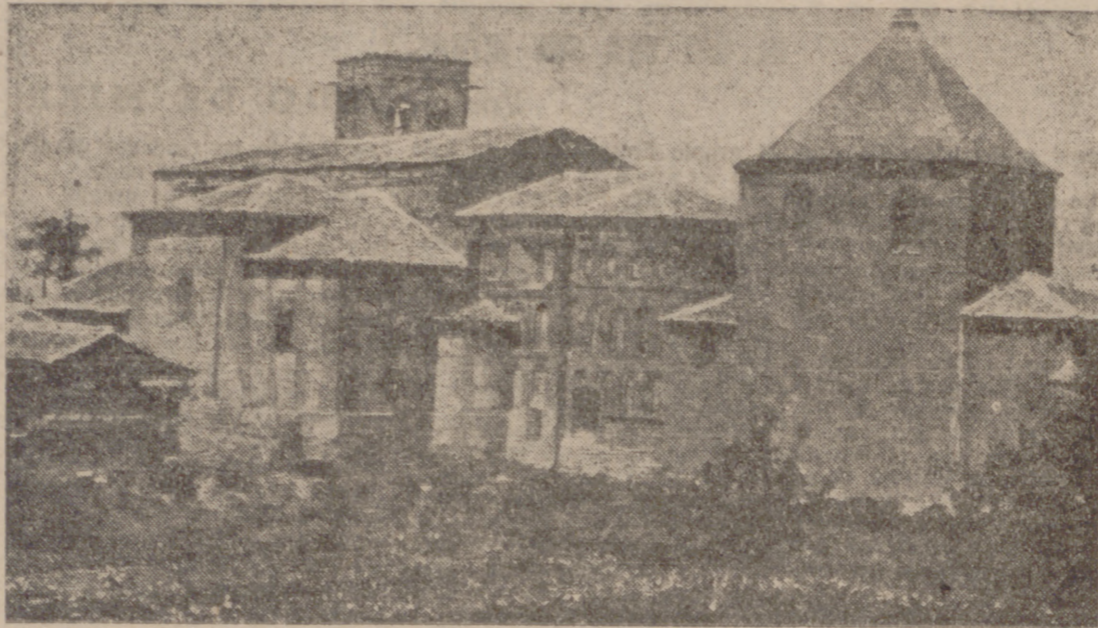
Iglesia de San Miguel y Capilla de la Soterraña

¿Qué más podemos decir sobre el espíritu omedano de estas fiestas? Allí hay hombres que poseen un viejo clásico espíritu falangista, aquel espíritu impulsivo y coordinador que propugnaba Onésimo Redondo, el