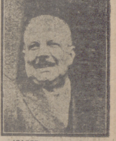
IBANEZ, nuevo presidente de Chile

DURO DOS MINUTOS Y MEDIO Buenos Aires, 5.—Un movimiento sísmico de dos minutos y medio de duración ha sido registrado por los Sismógrafos de la Marina, instalados en la isla de La Decepción, en el Antártico. Se calcula que el epicentro quedó situado a unos 100 kilómetros al Noroeste de dicha isla. No se han registrado daños, según anuncia la Marina.