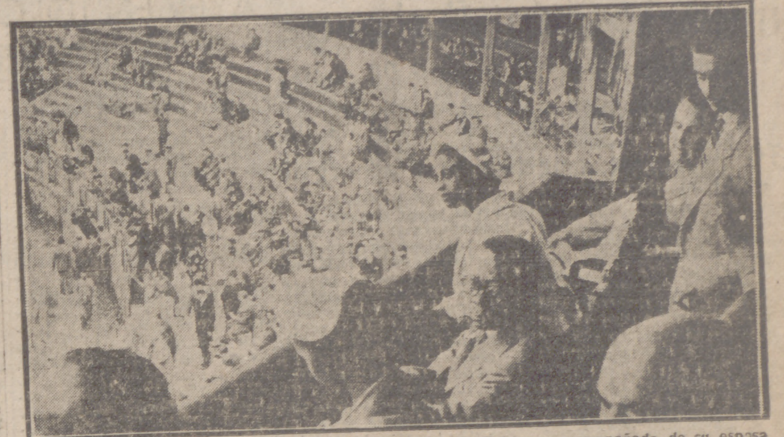
La Coruña.—El Presidente de Liberia, Mr. Williams V. S. Tubman acompañado de su esposa e hija y del ministro español de Asuntos Exteriores, señor Martín Artaño, en el palco de la Plaza de Toros de La Coruña momentos antes de comenzar la corrida.