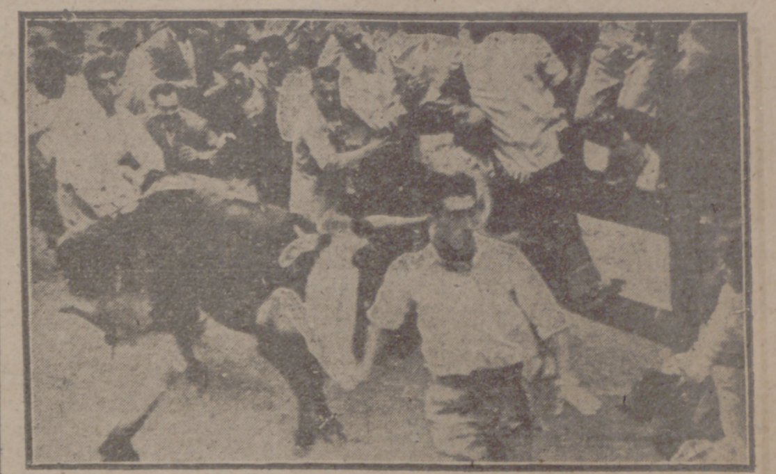
Pamplona. — Siguiendo la costumbre tradicional, los muchachos pamploncos durante los encierros de las reses que han de lidiarse durante las fiestas corren delante de los toros en su camino hacia la plaza de toros. En sus atropelladas carreras suelen caer unos encima de otros y exponerse a las cornadas, algunas veces graves, de los cornúpetos. En la foto, un momento del encierro efectuado en la festividad del Santo en el presente año.