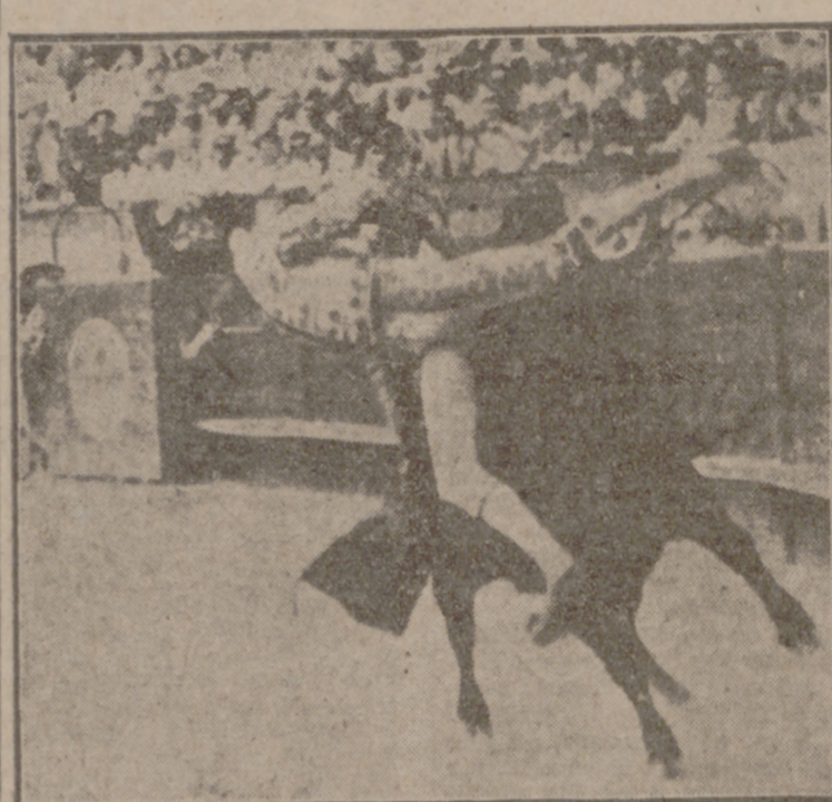
PALMA DE MALLORCA.—Un momento de la aparatosa cogida de Miguel Baez "Litri" en su primer toro de la corrida celebrada el pasado domingo.