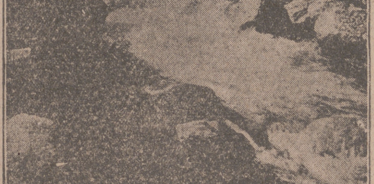
El Darro, uno de los ríos auríferos.

TRADICION AURIFERA HISPANA Cronistas e historiadores concuerdan en la extraordinaria riqueza que siempre tuvo España en cuanto a metales preciosos se refiere. Los tesoros subterráneos de la Península encontraron al-