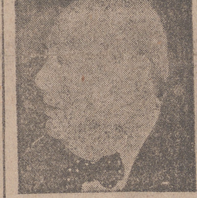
Winston Churchill en un momento de su discurso en los Comunes.

Fracasó la moción de censura contra Churchill