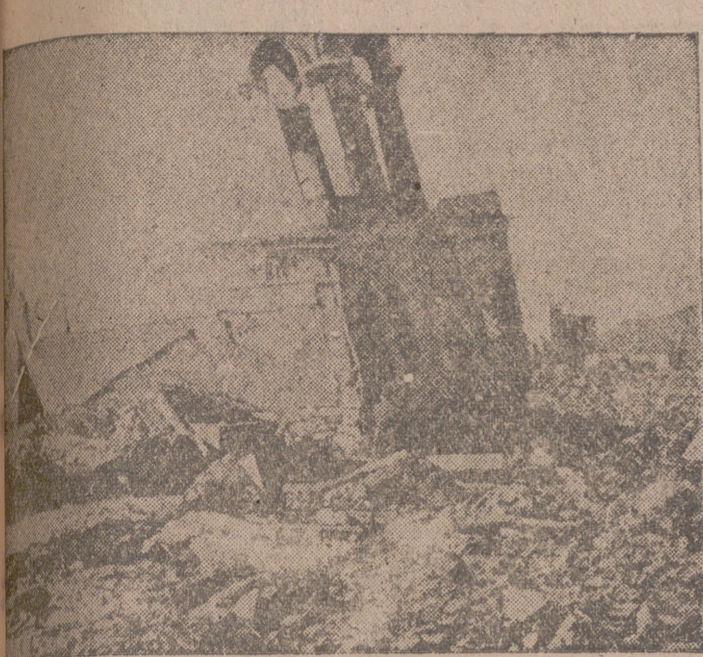
Foto es lo que acaso permanece más clavado en el pueblo alemán: el espectáculo de las ciudades arrasadas por los bombarderos.

"El Plan Marshall hemos de agradecerlo a Stalin"