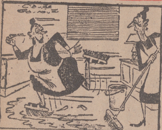
—¡Ah, amiguita, a los quince años yo era la reina del patin!

—¡Mi no me importa ser abuelo—dijo riendo el senador estadounidense Arthur H. Vandenberg cuando su esposa le notificó el nacimiento de su primer nieto—. Lo que me desazona ligeramente es estar casado con una abuela.