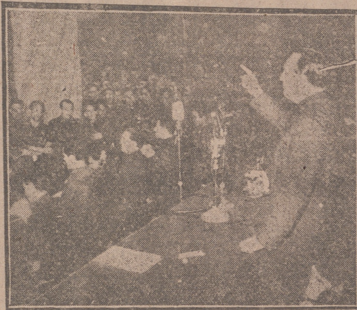
VALENCIA.—El ministro secretario general del Movimiento, camarada Fernández Cuesta, durante su discurso en dicho acto de clausura.