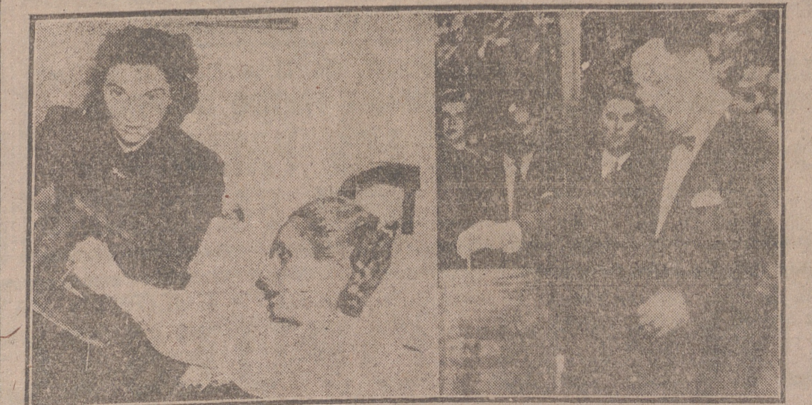
Buenos Aires.—En la composición fotográfica se recoge el momento de votar la esposa del presidente argentino, doña Eva Duarte de Perón, desde la cama donde convalece de la operación sufrida, y el propio presidente, general Perón, en su distrito electoral, en las primeras horas de la mañana del día 11 de noviembre.