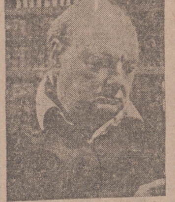
(INFORMACION, EN 4.ª PAGINA)

"Inglaterra camina hacia la bancarrota" "Hará el máximo esfuerzo por conservar el Canal" "El mundo no tiene confianza en la libra"