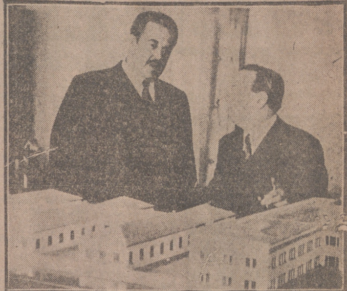
SEVILLA.—El ministro de Trabajo, don José Antonio Grón, durante su visita a la Escuela de Peritos Industriales de esta ciudad.