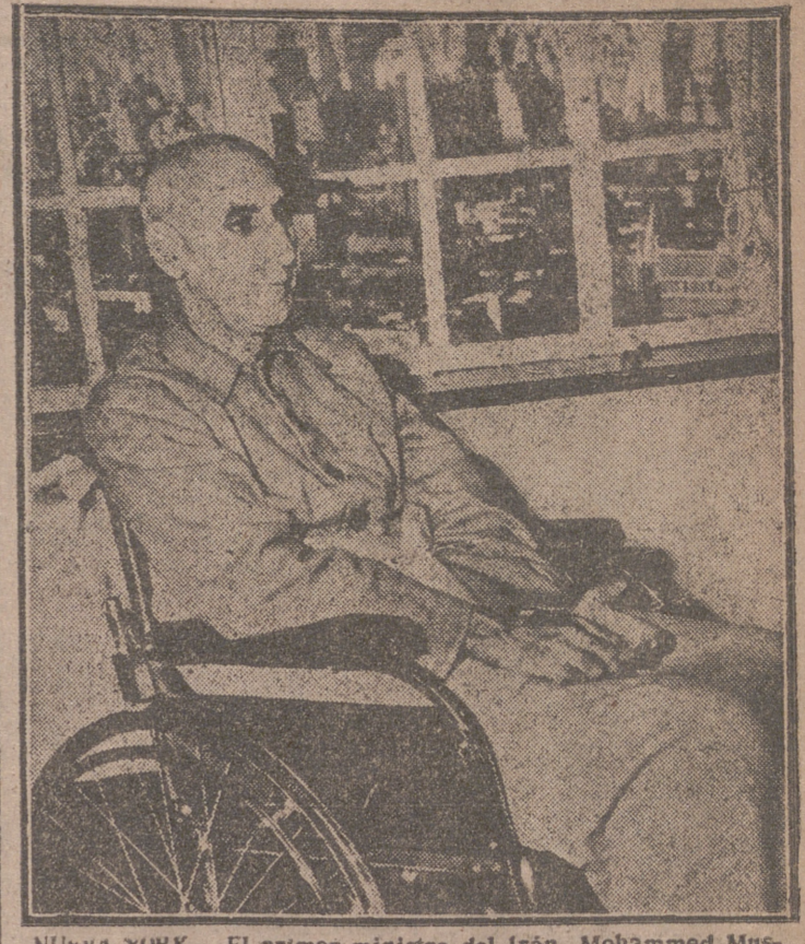
NUEVA YORK.—El primer ministro del Irán, Mohammed Mussadeq, posa para los fotógrafos ante una de las ventanas de la clínica donde permanece.