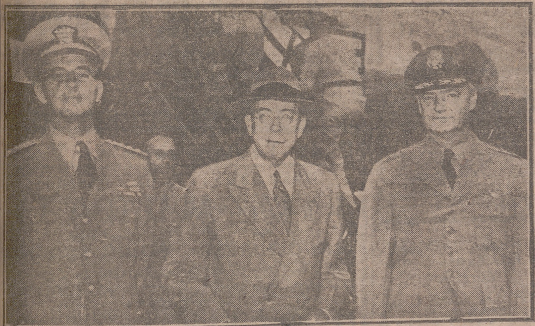
Los jefes de la Misión militar norteamericana con el embajador Stanton Griffis, que acudió con otras personalidades militares españolas a esperar a los militares norteamericanos al aeropuerto de Barajas.