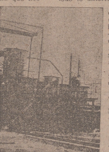
España necesita continuar la tarea de industrialización emprendida, pero asimismo es necesario la multiplicación rápida de las materias alimenticias.

desde 1936, y eso nos llena de satisfacción y de patriótico contento. Pero los alimentos no han seguido la misma curva de crecimiento, y en esa disparidad estadística se encuentra hoy, y acaso para largo tiempo, el problema económico de esa colectividad biológica y política que formamos, en este rincón del mundo, veintiocho millones de españoles.