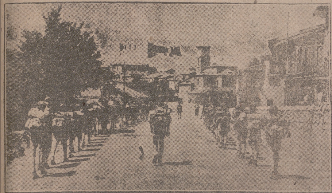
Con la canción en los labios, los muchachos falangistas llegan a este pueblo castellano dominado por el castillo. Pronto se levantarán las tiendas y comenzará la vida campamental, donde los muchachos del Frente de Juventudes se forman para ser completos españoles.