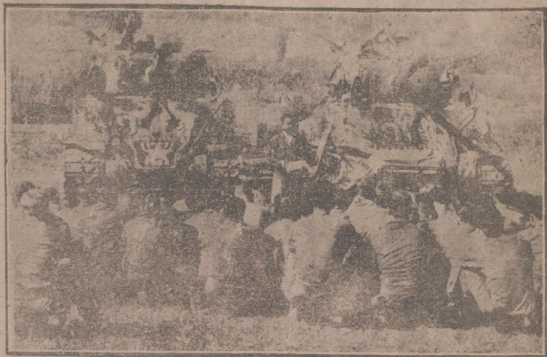
Mientras se decide si serán reanudadas o no las conversaciones, la guerra sigue su desarrollo implacable en Corea. Y con la guerra, la consideración de que la vida puede truncarse en cualquier momento. Hay que prepararse para la terrible contingencia. Por ello estos soldados se reúnen para escuchar la palabra del capellán, que ha improvisado su púlpito entre dos gigantescos tanques.