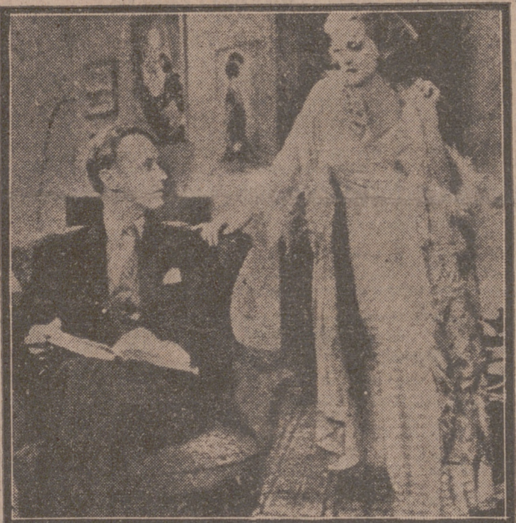
Leslie Howard en una escena de "Pigmalión", una de sus más destacadas creaciones

Nuestros placeres y alientos por este segundo boletín, a los que se hacen acreedores sus autores por su originalidad entre las publicaciones de esta índole y que demuestran—acaso sea esto lo más simpático—al respeto y elevado concepto que EIASA tiene de sus presuntos clientes.