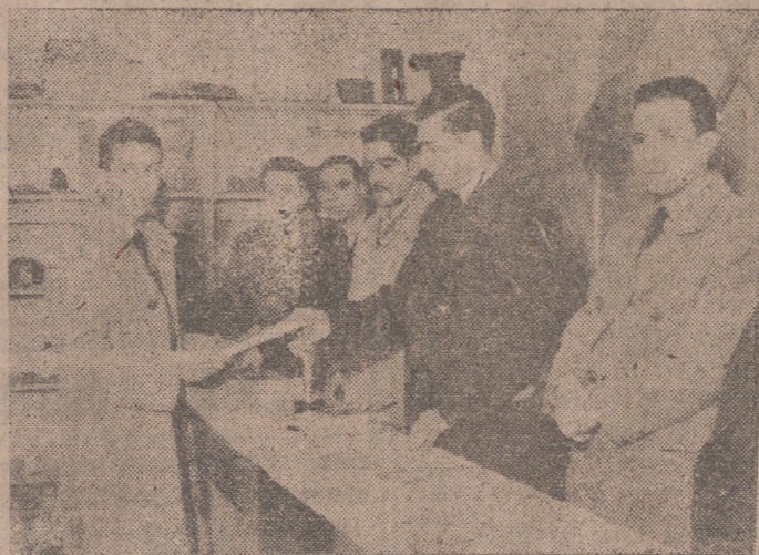
Un momento del reparto de premios. (INFORMACION, EN LA PAGINA CUARTA.)