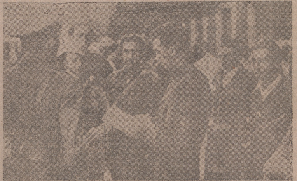
Esta foto—siempre presente en nuestro pensamiento—actualiza las palabras del Caudillo a nuestro Ayuntamiento. Por ellas bien puede quedar justificada su publicación, ya que trae, efectiva y dolorosamente, "el recuerdo de aquellos camaradas entrañables y heroicos soldados que partieron de Valladolid hacia el Alto de los Leones de Castilla para iniciar la gloriosa Cruzada nacional". El Ejército y la Falange, antes como ahora, aparecen inseparablemente unidos en heroica hermandad de una España nueva y mejor. Patria y marchar siempre los primeros para la conquista y posesión del etado de combate para salvar a la