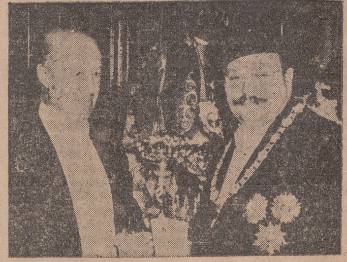
EL CAIRO.—Su Majestad el rey Faruk de Egipto, en compañía del embajador de España en El Cairo, don Domingo de las Barchenas, durante la recepción que el Soberano egipcio dió en su palacio en honor de los invitados a las fiestas jubilares de la Universidad Foad.