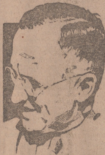
“Estamos dispuestos —añadió— a negociar acuerdos honorables con la Unión Soviética, pero no nos comprometeremos en el apaciguamiento.”