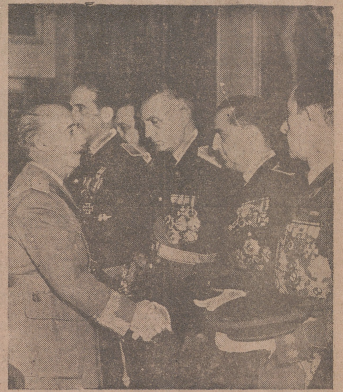
MADRID. — Presididas por los ministros del Ejército, Marina, Aire, Gobernación y Justicia acudieron al Palacio de El Pardo nutridas representaciones de todas las Armas y Cuerpos del Ejército para saludar a S. E. el Jefe del Estado con motivo de la Pascua Militar.