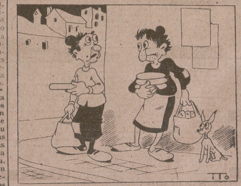
ESTRAPELLO EN RUINA.—Por ITO. —El dar más pan nos ha matado. —Si; esto se nos pone muy duro.

No es, pues, extraño que un sentimiento de justificada alarma se haya extendido por las esferas políticas de Tokio—tanto niponas como aliadas—a la vista de la actuación de la diplomacia rusa en los problemas que afectan a la paz de estas regiones. Cabe preguntarse, visto cuál es el comportamiento moscovita frente a problemas que ni remotamente se relacionan con la estructuración de la paz, cuál será la política que Rusia reclame a la hora de decidir la normalización de la situación en Extremo Oriente. Claro está que hasta que ese momento sea legado se presentarán múltiples ocasiones para decidir la cooperación futura entre las grandes potencias con intereses esenciales en Oriente. Y entonces, una disociación definitiva entre las más influyentes colocará en manos de la más fuerte la decisión, y ésta no se espera que resulte totalmente desfavorable. Por el contrario, un acuerdo podría suponer la imposición de mayores sacrificios al Japón vencido; por eso se acogen aquí con interés todos los indicios reveladores de que cada día va resultando más improbable la sincronización de la política de dos potencias que, hoy por hoy, son hostiles más que rivales en la esfera asiática.