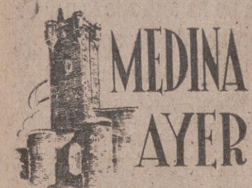
MEDINA DEL CAMPO AYER