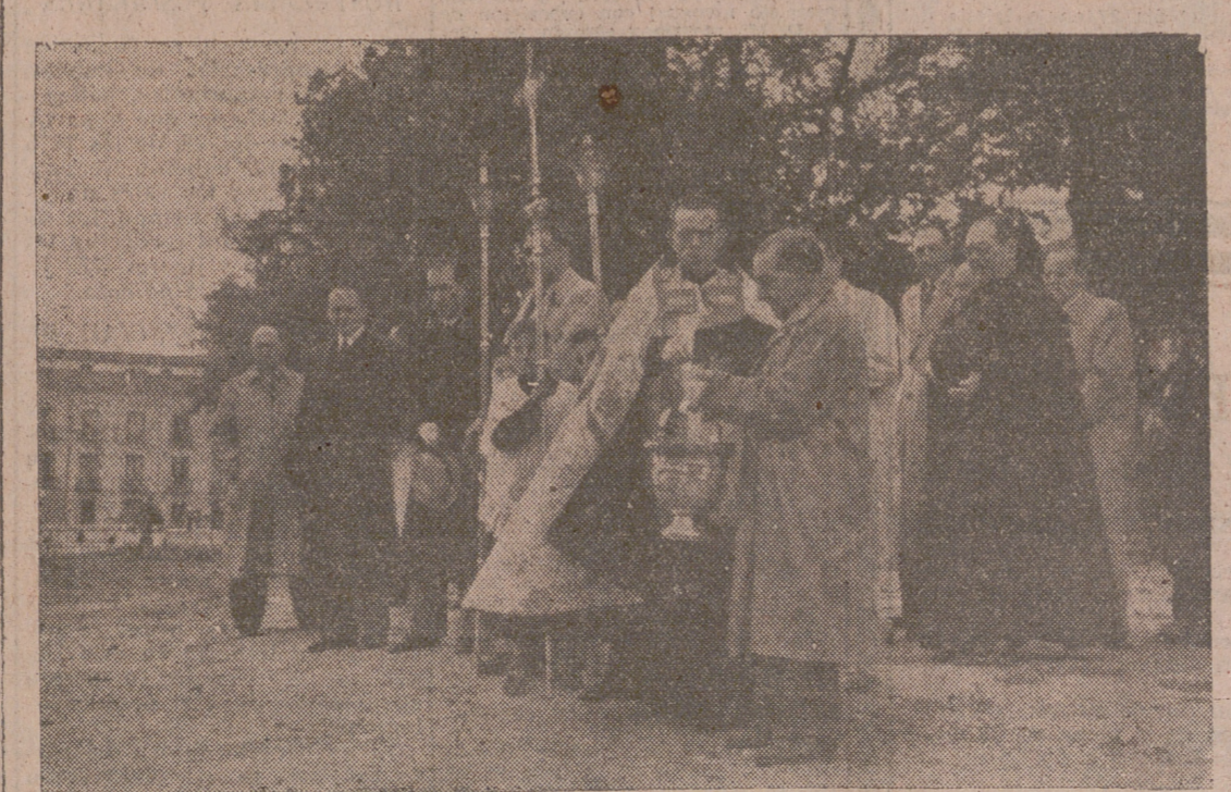
(Información en página cuarta.)