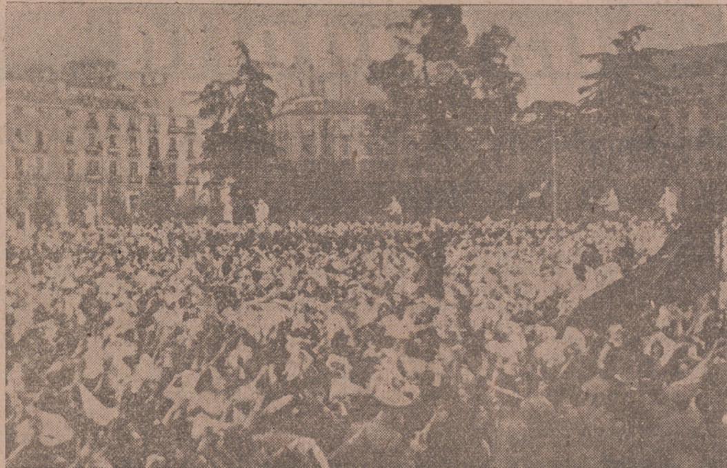
Madrid.—La muchedumbre aclama a S. E. el Jefe del Estado, al que siguió hasta el Palacio de Oriente, después de su trascendental discurso en las Cortes Españolas.