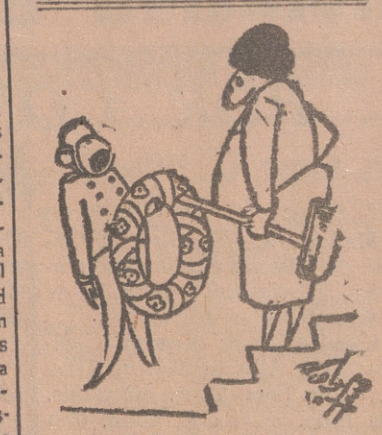
—Oiga, portera. ¿Vive aquí el señor que murió anoche?