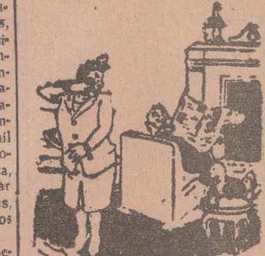
—He renunciado a dos hombres por tí; para que te enteres. —Y yo a todas las mujeres de las que te conozco.