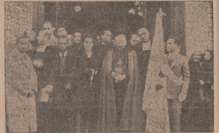
Grupo de autoridades eclesiásticas, madrina y Hermanos en la solemne bendición de la bandera de Acción Católica del Colegio Hispano. — (Información en segunda página.)