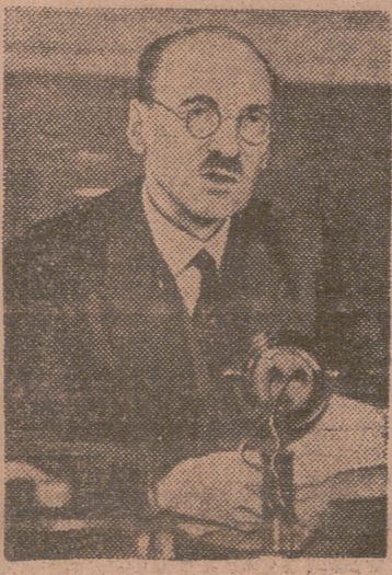
El general Moscardó, en Málaga

Londres, 10.—La declaración del director general de la agencia Reuter a propósito de un folleto del Departamento de Estado de Washington en que se acusaba a dicha agencia de ser un organismo de la propaganda británica, ha suscitado el mayor interés en todo el mundo y varios de los principales periódicos estadounidenses—entre ellos el «Washington Star», «Washington Post», «Baltimore Sun», «Chicago Tribune», «New York Times» y «Herald Tribune»—publican un extracto de ella. Los diarios de Canadá, África del Sur, India, Australia y Europa, destacan grandemente la declaración y algunos la comentan, como el «Sidney Morning Herald», que dice que el documento americano revela envidia al servicio de información británico de la agencia Reuter.—Efe.