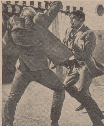
Director: Robert Clouse. Guión cinematográfico de Ed Waters, basado en la novela de John D. MacDonald.