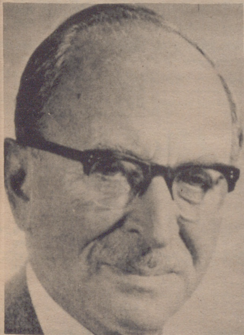
ESTOCOLMO.— El profesor Dennis Gabor de 71 del Imperial College de Ciencia y Tecnología de Londres, ha sido galardonado con el Premio Nobel de Física según anunció hoy la academia sueca.

● LOS NUEVOS PREMIOS NOBEL DE FISICA Y QUIMICA