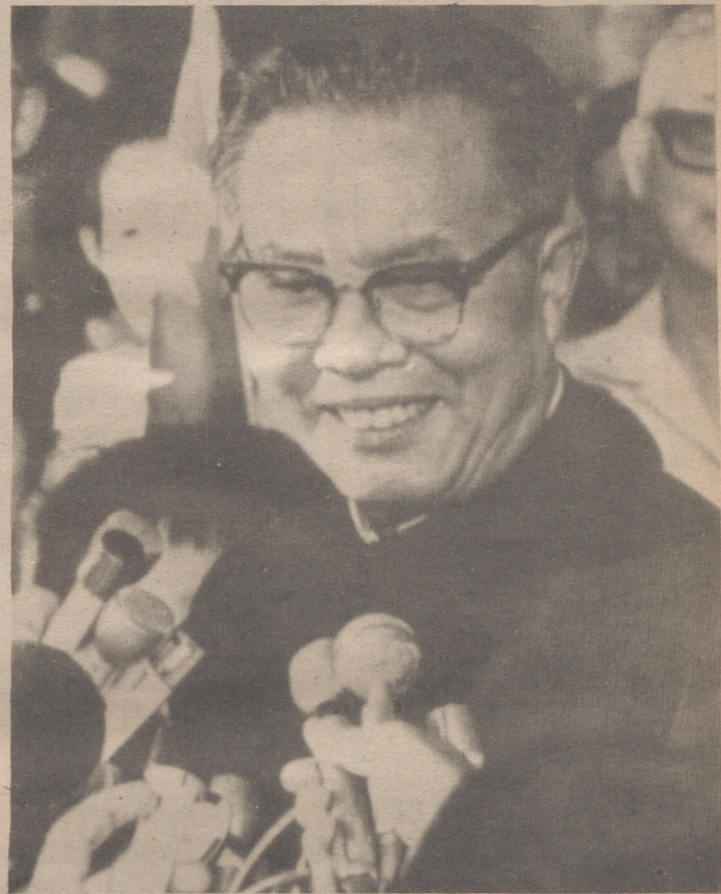
Huan Hua, hasta hoy embajador de China comunista en Canadá, ha sido embajador de la China Popular ante las Naciones Unidas. Será el primer representante permanente de la China continental en el consejo de Seguridad.

● PRIMER EMBAJADOR DE CHINA COMUNISTA EN LA ONU