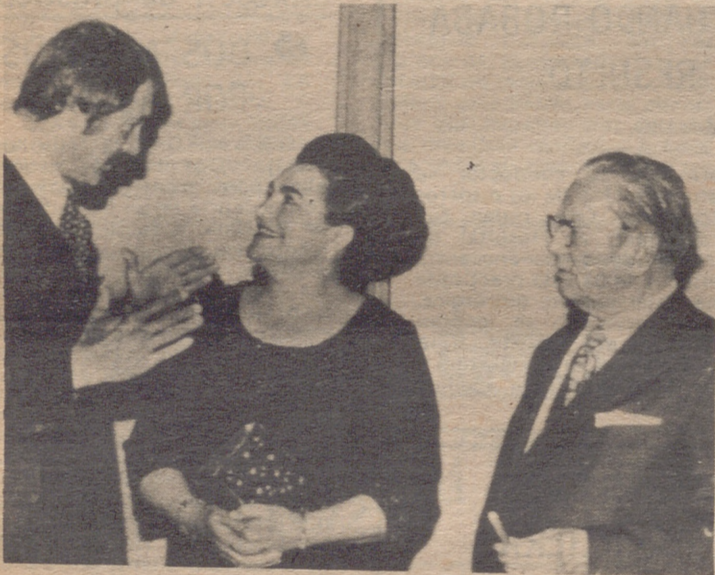
HOLLYWOOD.— El presidente de Yugoslavia Josip Tito y su esposa conversando con el actor Rock Hudson durante su visita a los estudios Universal de Hollywood. A Tito y señora le fué ofrecida una recepción por el Alcalde de Los Angeles a la que asistieron también las estrellas del séptimo arte.