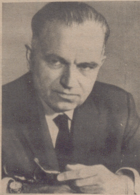
Gerhard Herzberg de Consejo Nacional de Investigación de Ottawa, científico canadiense nacido en Alemania que ha obtenido el Premio Nobel de Química por sus investigaciones en estructuras atómicas y moleculares.