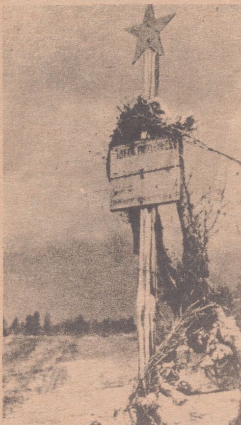
Su tumba sería quizá como la que muestra la foto. Un poste rematado con la estrella de cinco puntas, junto al camino nevado.

Aquí residían los primeros cien niños españoles que fueron evacuados de la zona republicana durante la guerra de liberación de España. Corría el año 1937.