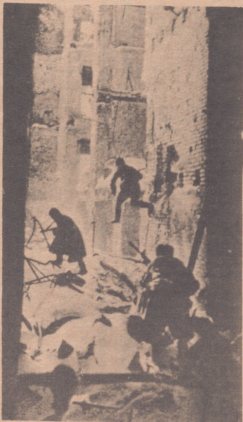
Murió en Stalingrado, donde alemanes y rusos combatían de casa en casa.