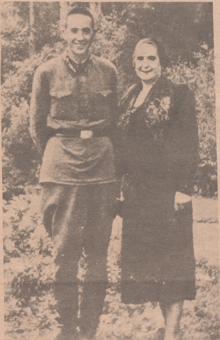
"La Pasionaria" con su hijo

Hasta su muerte en la defensa de Stalingrado, permaneció muy unido a su padre