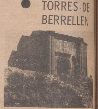
TORRES DE BERRELEN