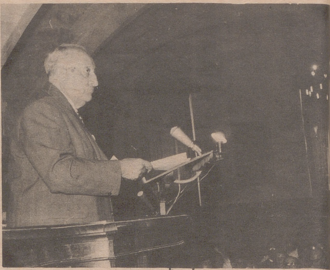
SALAMANCA.— En la Universidad Salmantina ha tenido lugar la inauguración del curso de verano para extranjeros. La lección inaugural estuvo a cargo del escritor y premio Nobel Miguel Angel Asturias, habló de "Mi obra novelística". (Foto Europa Press).