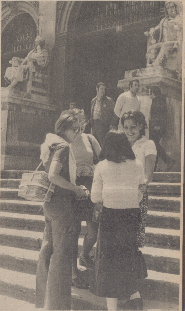
FACULTAD DE MEDICINA

El tónica e inexactamente, "buen" estudiante, recuerda que ha desayunado con libros que le ha visto el sol madrugador con libros. Que el sol de mediodía se ha quedado estupefacto al seguir