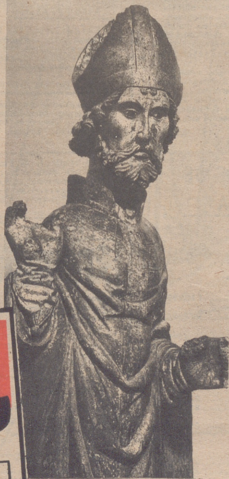
Yugoeslavia artística: Estatua en madera de San Nicolas

Obliga a pensar en la decadencia de la personalidad humana. Un palacio de un emperador, ya medio decadente sirve de ciudad. Nunca podrán construir nada como hizo el escéptico y cansado, pero objetivo, Diocleciano. Vivimos en una época de enanos. No vale argüir que, para esas grandes obras y esas peralidades, se necesita, como enseñaba Aristóteles, a los esclavos.