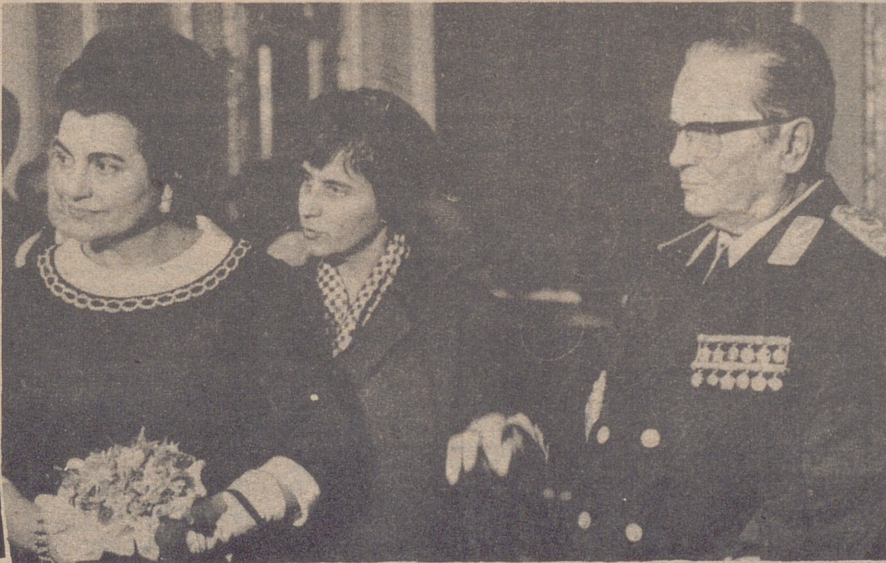
Tito con su esposa y su interprete, detrás de ella