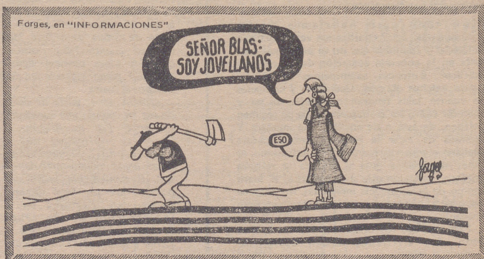
Forges, en "INFORMACIONES"