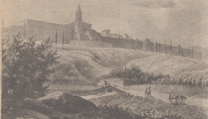
Grabado de Jaca en 1846.

● ¿Podemos destruir su paisaje con edificios descomunales?