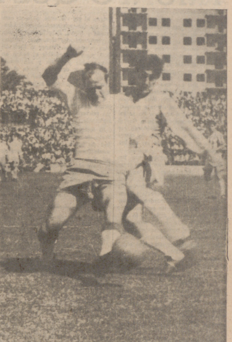
DUELO LOCAL-GOMEZ.—Desde el primer momento el ariete Docal y Gómez mantuvieron una constante pugna, sancionada de violencias, casi siempre por parte del central.

TEMPERATURA IDEAL Con frío y calor HOSTAL FLORIDO EL MEJOR LA NOVEDAD TRALLERO