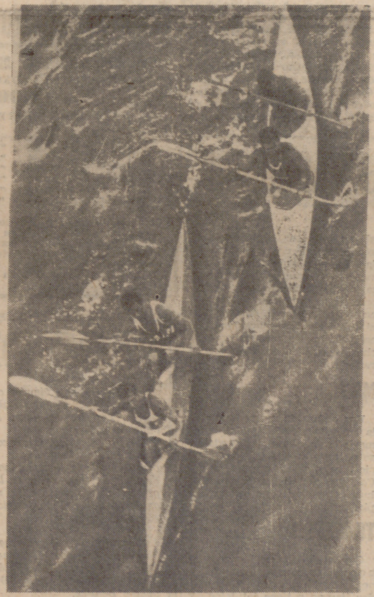
Feliz y Gutiérrez y Juan y Julio, en pleno duelo, resuelto a favor de los primeros.

CLASIFICACION POR EQUIPOS 1. Grupo Cultural Covadonga, de Gijón. 2. Corisa-Rápidos, de Arriónidas. 3. Cisne O. J. E., de Valladolid.