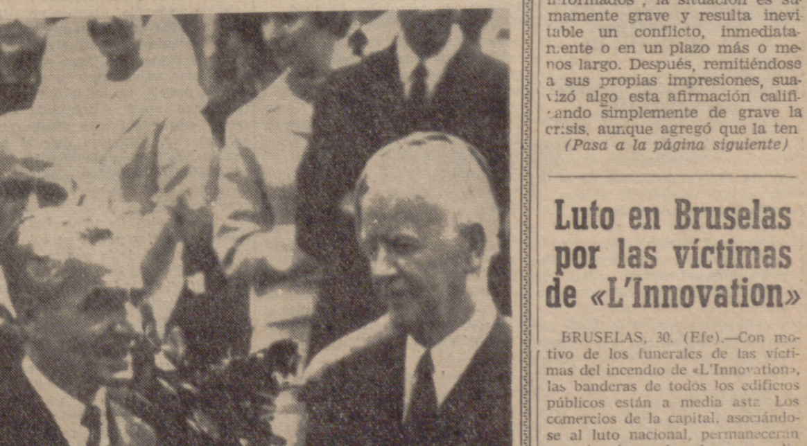
BONN.—El presidente de la República Federal Alemana, Luebke, conversando con el Sha de Persia, durante su entrevista con motivo de la visita oficial de este último a Alemania.