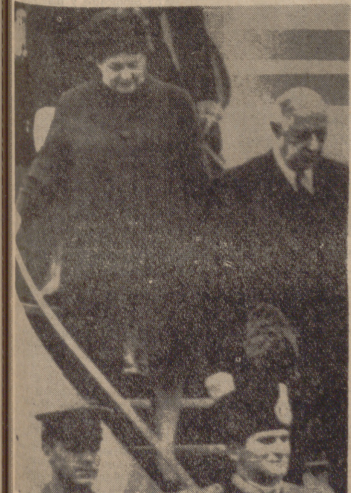
ROMA.—El presidente De Gaulle y su esposa descienden del avión que les ha traído hasta el aeropuerto de Ciampino. Asisten al Presidente francés a los actos conmemorativos del décimo aniversario de la creación del Mercado Común.