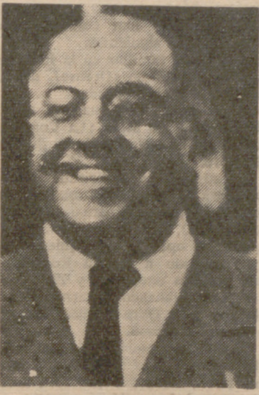
GEORG WILHELM PABST