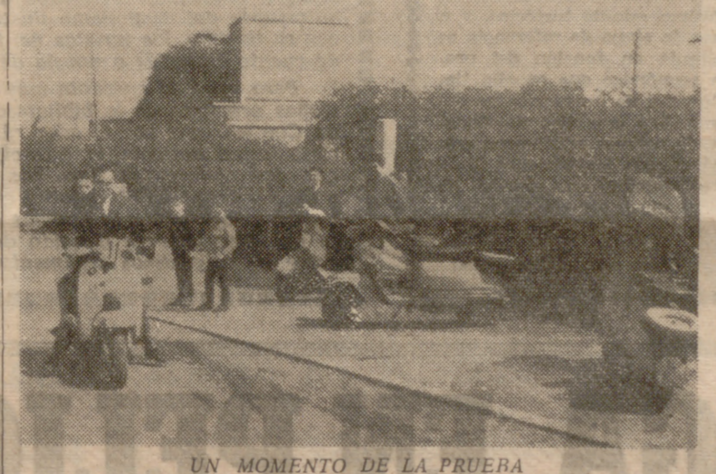
UN MOMENTO DE LA PRUEBA