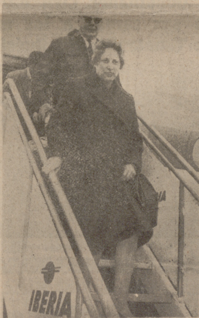
MADRID.—La princesa Carolina de Dinamarca estuvo veinticuatro horas en Madrid, antes de regresar a su país. En la foto, la princesa Carolina desciende del avión que desde Tenerife la trasladó a Madrid. La princesa ocupaba una butaca de clase turística.