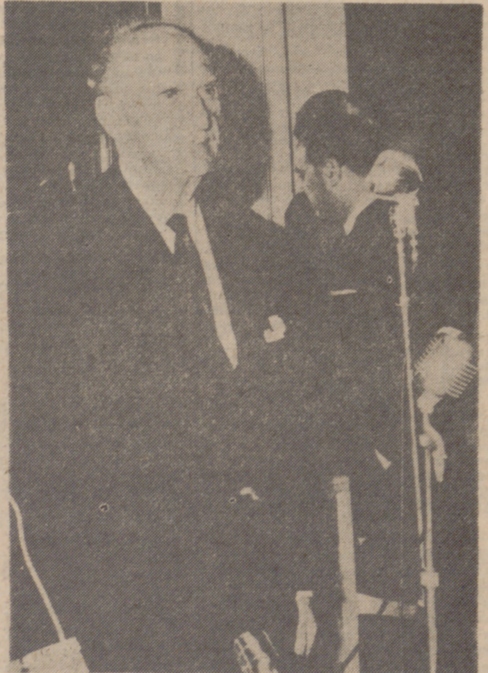
Jorge Papandreu (ochenta años), jefe de la "Unión del Centro", partido antimonárquico.

En nuestro primer artículo hemos probado que la actual situación de la monarquía en Grecia se halla en peligro a causa de las luchas partidistas entre los defensores y detractores de la misma. La fuerza de los antimonárquicos es grande y, según parece, bien organizada. En verdad que nosotros tenemos por la suerte que en un plazo más o menos corto pueda sufrir. Ciertamente que muchos opinan que las monarquías ya no son regímenes adecuados para nuestros tiempos, y a esto nosotros no decimos más que será el mejor régimen político en las naciones el que más justamente sirva al pueblo y encarne su voluntad de orden, justicia, progreso y paz. Pero el caso es que hay momentos, como el presente de Grecia, en que la caída del régimen monárquico por los medios que intenta Papandreu y la sustitución que propone, lejos de prometer un porvenir más justo y equitativo muestra graves amenazas con consecuencias peligrosas para la nación y la organización de su vida social. La caída de la monarquía de Grecia en el momento actual transferiría totalmente su paz interior, sus aspiraciones y su forma de vivir a modo accidental. Los razones de este nuestro parecer las tenemos en los principales puntos que propugnan los partidos antimonárquicos, capitaneados