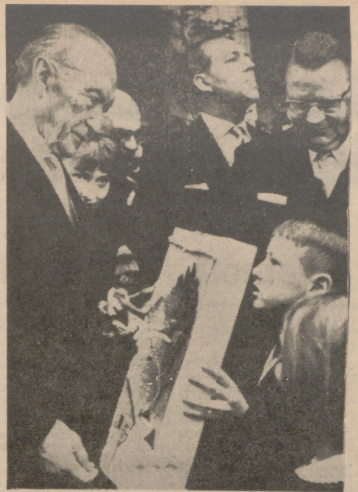
El excanciller de Alemania occidental, Konrad Adenauer, recibiendo de un pequeño huérfano un regalo con motivo de celebrar su ochenta y nueve cumpleaños.

comunicar la triste noticia, dijo: "Adenauer se ha dormido tranquilamente para siempre". Minutos después de la muerte del excanciller federal, la bandera alemana fue colocada a media asta sobre la residencia de la familia Adenauer en Rheindorf. Las emisoras de radio y televisión interrumpieron sus emisiones para dar al pueblo la noticia. Al mismo tiempo en que el portavoz de la Cristianodemocracia, partido del cual era presidente de honor el fallecido político, facilitaba la noticia, colaboradores de Konrad Adenauer comunicaron personalmente el fallecimiento a los embajadores de los países que durante la larga enfermedad del anciano político siguieron permanentemente el proceso de la misma. Sobre el Palacio de Schaumburg, sede de la Cancillería Federal, y sobre todos los edificios públicos y embajadas acreditadas en Bonn y en la ciudad diplomática de Bad Godesberg, la bandera de la República Federal de Alemania y la de los países representados ante el Gobierno Federal aparecen izadas a media asta.