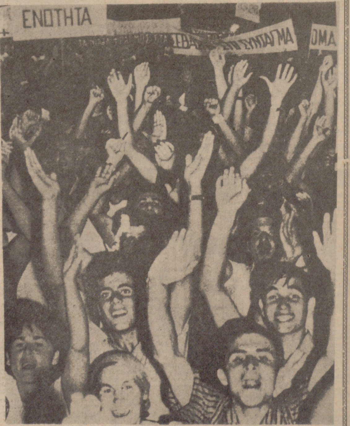
En la época del Gobierno de Papandreu, una manifestación de estudiantes gritando: "¡Abajo el Rey!".

Los antimonárquicos griegos desean un cambio total en la estructura social, y Papandreu, aunque frecuentemente dice: "No soy comunista; soy, sencillamente, socialista-progresista" sin embargo la doctrina de su programa es un trasunto del marxismo y no sólo en palabras, sino también en los hechos consumados. En el año 1963, cuando tras las elecciones consiguió ciento sesenta actas de diputados en el Parlamento y ocupó el Gobierno de la nación, Papandreu, como jefe de los antimonárquicos, inició planes económicos a nivel filocomunista y espantó al capital, sin provecho para nadie, ni para los clases débiles. Fue un estatista económicamente comunista, pero endiosado al Estado como dueño y señor de todo, con respecto del pueblo en general. Por otra parte siguió la acción de los países marxistas en la depuración del Ejército, y así, empujó a su hijo Andrés, militar de alta graduación, introducir en los cuadros de mando a individuos de tendencia comunista. Estas y otras medidas de política interior de aquellos días de 1963 sí caía la monarquía y se encontraba con el pleno Gobierno en sus manos, las acrecentaría al estilo comunista. En relación con la política exterior, la caída de la monarquía griega traería como primera consecuencia la debilitación de la NATO, alejándose de la