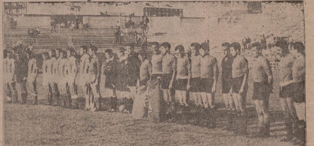
Antes de comenzar el encuentro, los dos equipos formaron en el centro del campo para escuchar los himnos portugués y español.