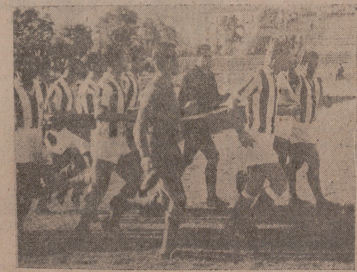
LOS EQUIPOS SALIERON AL CAMPO PORTANDO LAS BANDERAS DE SUS RESPECTIVOS PAISES Y DIERON ASI LA VUELTA AL TERRENO DE JUEGO, ENTRE LOS APLAUSOS DE LOS ESPECTADORES, COMO UN PROLOGO DE UN PARTIDO INTER-NACIONAL DE CAMPANILLAS.