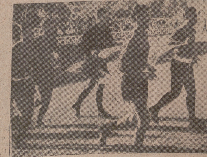
LOS EQUIPOS SALIERON AL CAMPO PORTANDO LAS BANDERAS DE SUS RESPECTIVOS PAISES Y DIERON ASI LA VUELTA AL TERRENO DE JUEGO, ENTRE LOS APLAUSOS DE LOS ESPECTADORES, COMO UN PROLOGO DE UN PARTIDO INTER-NACIONAL DE CAMPANILLAS.