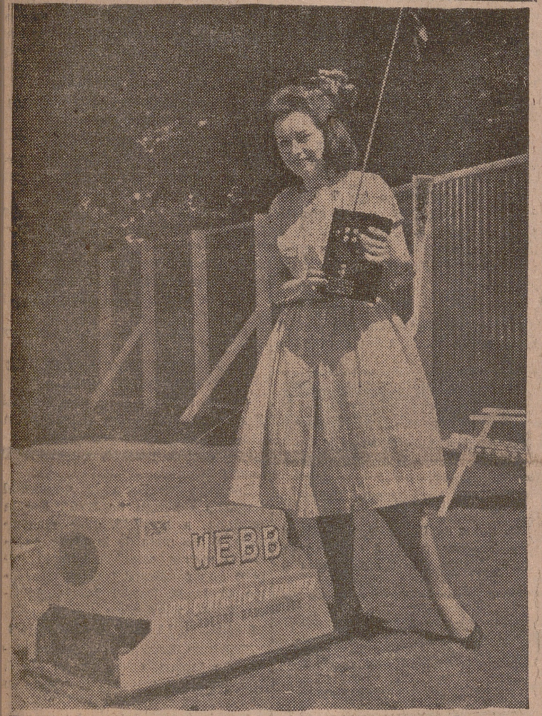
El cuidado de los jardines del futuro es completamente revolucionario. Desde muchos metros de distancia pueden hacerse las operaciones más importantes del mismo: riego, cuidado de los macizos, etc. Todo ello con este sencillo aparato creado por un ingeniero, que ha sido presentado en la exposición de París. Esta señorita está efectuando esas operaciones mientras puede tranquilamente charlar con cualquiera.