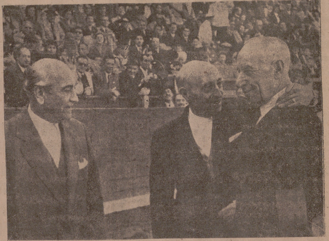
La estampa es una vuelta completa en la historia de la Fiesta Nacional. "El Gallo", Vicente Pastor y Bienvenida, padre, en la Plaza de las Ventas de Madrid, el día del homenaje al fallecido torero. Aquella tarde, nueve mil cigarros puros se amontonaron en la arena.

Había toreado más de doscientas corridas y dividió la opinión pública en dos bandos. Catorce cornadas, de ellas dos gravísimas, eclipsaban el criterio de quienes le creyeron amigo de las "espantás". Gloria y tristeza de uno de los toreros más famosos de la Fiesta Nacional