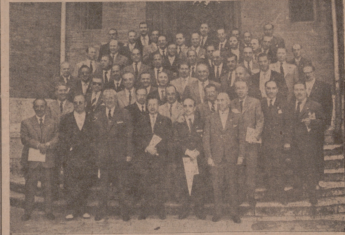
La promoción de médicos que finalizaron la carrera en la Universidad vallisoletana en el curso 1929-35, celebraron ayer sus Bodas de Plata con la profesión con diversos actos. Por la mañana, en el Santuario Nacional de la Gran Promesa tuvo lugar una solemne misa, presidida por el señor Arzobispo. Finalizado el acto religioso, fueron recibidos en el Ayuntamiento por el Alcalde de la ciudad, y acto seguido se reunieron en el Hotel Conde Anárez en un íntimo almuerzo. Luego visitaron el Museo Nacional de Escultura, y por la noche finalizaron los actos con una cena-baile en el Hotel Felipe II.