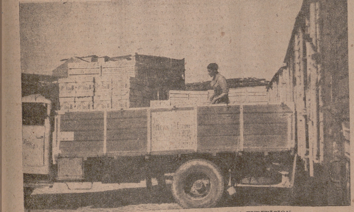
DOS MOMENTOS DEL CARGAMENTO DE LA EXPEDICION