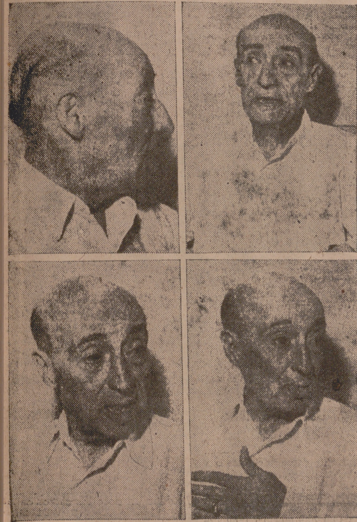
Cuatro expresiones del torero, pocos meses antes de morir.

Con la muerte de Rafael Gómez "El Gallo", todo un símbolo de la torería ha desaparecido de España. Y con él una escuela plagada de los mejores recuerdos taurinos, donde tardes de sol y esplendor le enviaron el mejor de sus aplausos, las más cálidas de sus ovaciones en pago y correspondencia a lo que en él fue, legal e indiscutiblemente, vergüenza torera.