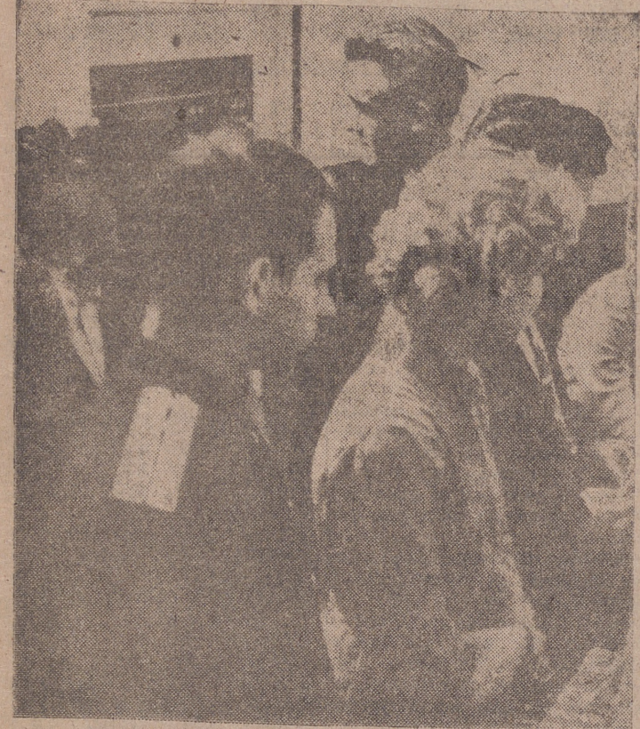
ESTUDIANTES RUSOS, ENTRE ELLOS UN MILITAR

lado, un edificio feísimo, de puro estilo boyardo, donde el Gobierno ha instalado los almacenes "Gum", que venden de todo y donde el viajero no sabe qué adquirir, porque no hay nada típico, nada que pueda servirnos de recuerdo. Al norte, el Museo de Historia, con su fachada rojo-sangre, y al sur, las cúpulas de la Catedral de San Basilio, mandada construir por Iván el Terrible, quien según la leyenda ordenó cegar al arquitecto para que no pudiera edificar otra semejante.