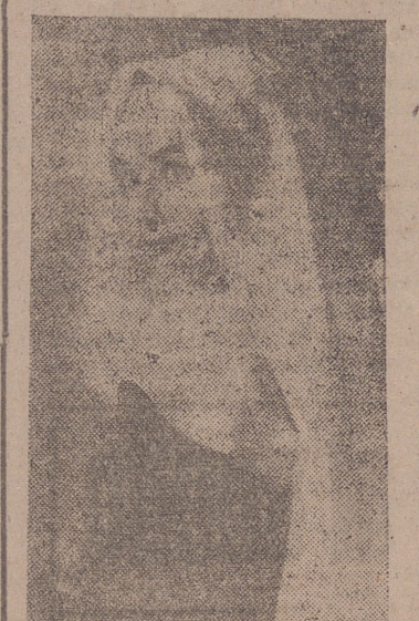
Audrey Hepburn en la película "Historia de una monja".

Pero Audrey Hepburn en tan duro trance tuvo la suerte de tener a la cabecera de su cama a la dulce monja de la historia que acababa de encarnar en el cine: a la Hermana Luc, que