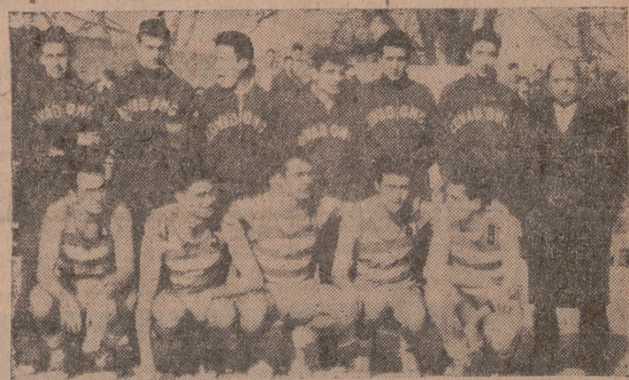
El equipo del Grupo Covadonga, que ayer venció al A.A. La Salle.

brada "garra", que a la postre iba a resultarle providencial para obtener la victoria. Sin desanimarse por la fulgurante salida de los salmantinos, fueron imponiendo su juego y peculiar estilo, hasta lograr remontar el marcador y llegar al fin de la primera parte con ventaja de 17-20. En la continuación, el juego cobra aún más emoción por la marcha del marcador, que refleja continuos empates y ligeros despegues de ambos equipos. Cuando faltan dos minutos, el La Salle llevaba ventaja de dos puntos, pero inmediatamente Roncero consigue transformar dos "palmeos", precedidos de personal los dos, pero que el señor Duque no vio, y esto le valió al Grupo la victoria, remachada al final por un tiro libre de Varela.