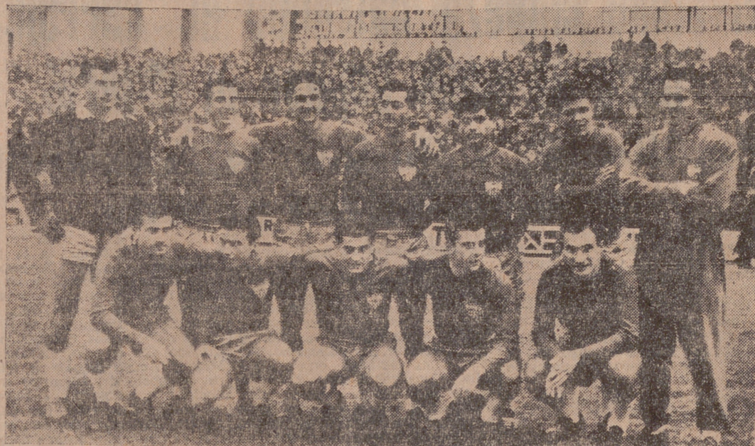
EL "ONCE" QUE AYER ALINEO EL SEVILLA EN EL ESTADIO VALLISOLETANO Y QUE FUE BATIDO POR EL REAL VALLADOLID