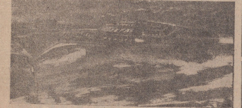
Ultimamente se ha hablado de grandes descubrimientos científicos rusos en el aspecto del mar. En este dibujo se muestra el posible motor de agua sin combustible.

...mente se ve en el país de los soviets o en ciertas regiones del Mar Rojo cuando se imitan las peregrinaciones hacia la Meca. La única diferencia consiste en que los rusos no chillan, no aborotan, ni protestan, ni pretenden ganar puestos a fuerza de empujones.