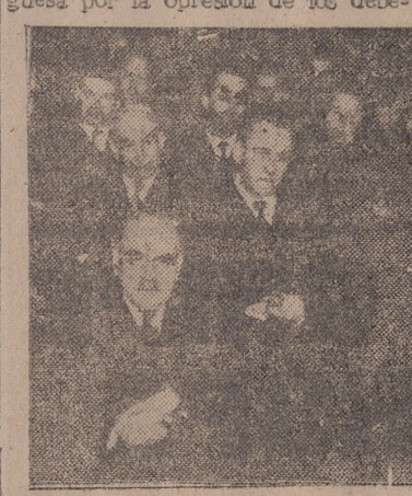
UN ASPECTO DEL PUBLICO

fermo". Señaló que la Medicina ha sido en todo tiempo de alguna manera psicosomática, no así la patología, que no ha tenido este carácter hasta hace muy poco tiempo. Analizó la historia de la patología, disponiendo su estudio en tres períodos: los primeros decenios del siglo IV antes de Jesucristo, que calificó de posibilidad frustrada; el segundo, desde entonces hasta principios del siglo XX, en el cual destacó la importancia de la doctrina cristiana al dar una nueva concepción del ser humano y que señaló como posibilidad olvidada. Por último, una tercera etapa, la que comienza a finales del siglo XIX y principios del XX, que condicionan tres supuestos, los cuales han permitido el desarrollo de la patología psicosomática en nuestros días. Son estos supuestos: Primero, una situación histórico-social que se da en el Occidente y caracterizada por una disolución de la sociedad burguesa por la opresión de los debe-