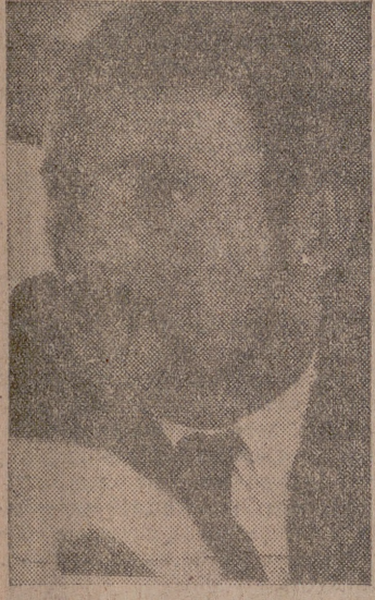
Lagaillarde, que se ha entregado.

El Presidente pedirá hoy los plenos poderes