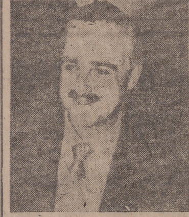
Alfonso Paso; un estreno por semana. Y ahora va a dedicarse también a dirigir.