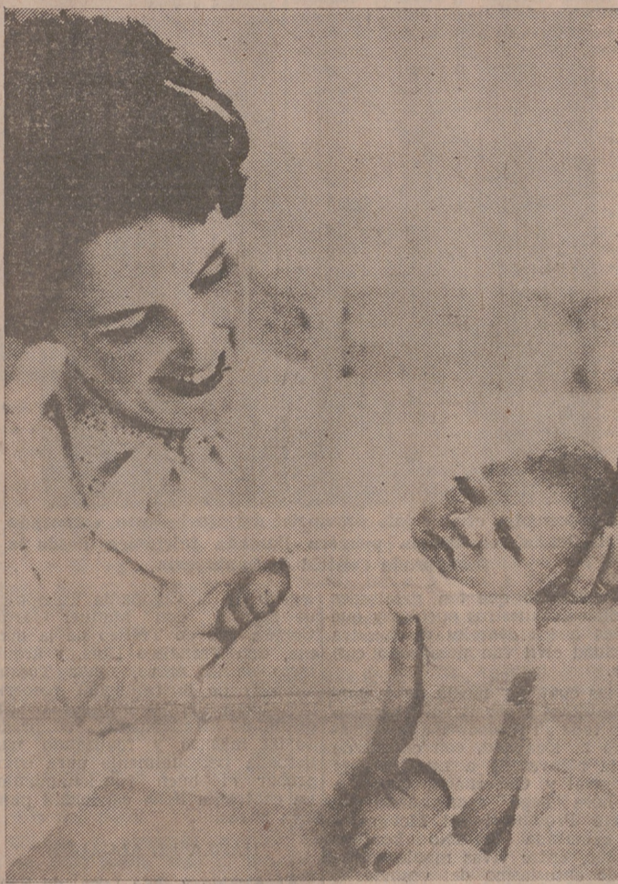
María Teresa Wurtemberg, casada con el Conde de Clermont, Enrique de Francia, hijo del Conde de París, ha dado a luz una niña, la princesa María Isabel Margarita Ana. Querían un niño, que a su tiempo hubiese heredado el título de pretendiente al trono de Francia. Otra vez será.

Las mejores fotografías del mundo en «ARRIBA»