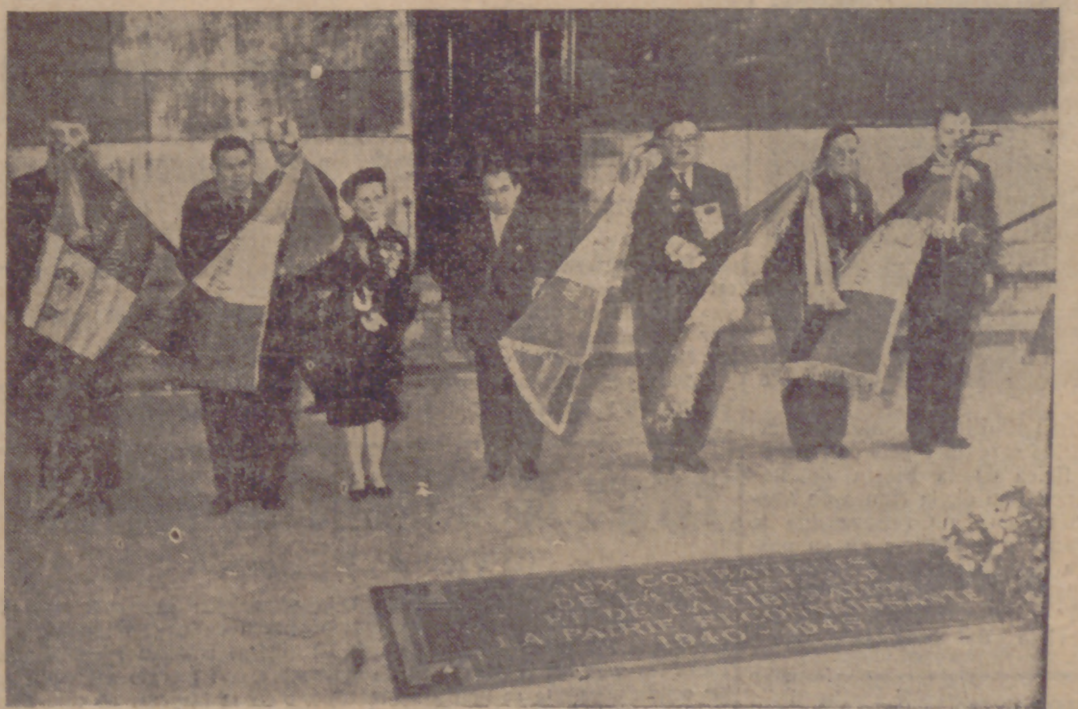
Una placa en recuerdo de los muertos en la resistencia ha sido descubierta en el Arco de Triunfo en presencia de relevantes personalidades. En la foto, los antiguos combatientes delante de la nueva placa.