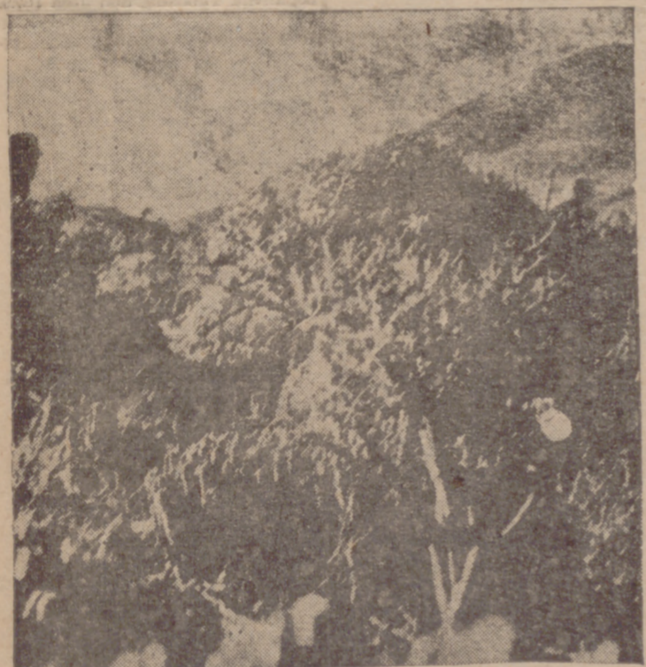
Una fotografía tomada durante el avance de nuestras tropas para liberar a los sitiados.