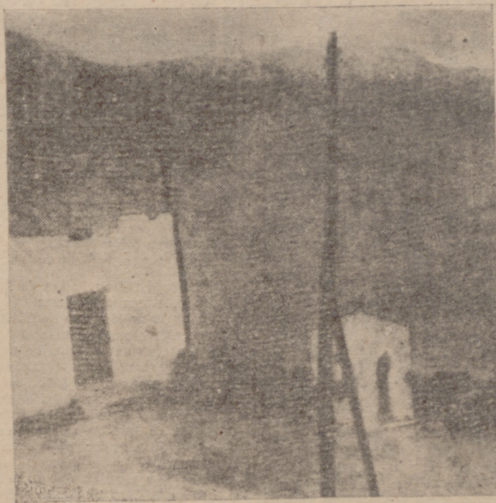
Uno de los fuertes donde tan heroicamente se combatió.

A las cinco de la mañana del día 7 de diciembre, después de haber confesado con el "Pater" de la Compañía la totalidad de los componentes de la misma, comenzamos la última etapa para nuestra llegada al fuerte de T'Zenin de Amel-lu. Hasta unos tres kilómetros de distancia del fuerte nuestra marcha transcurrió sin novedad. A esta distancia vimos ondear la bandera de España. Gran