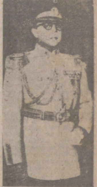
El presidente de Venezuela, Marcos Pérez Jiménez.

Unidades de Infantería y Aviación han luchado un solo día En la base militar de Maracay, a 80 kilómetros de Caracas SEGUN EL PRESIDENTE MARCOS PEREZ JIMENEZ, REINA LA CALMA EN EL PAIS