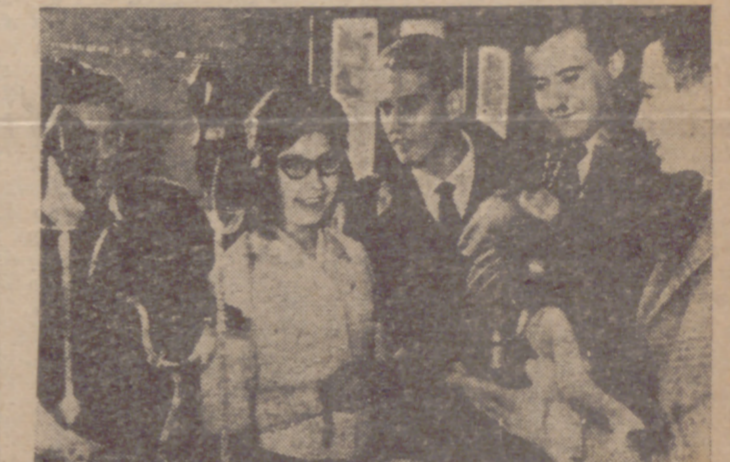
Los estudiantes, en la inauguración de la nueva Cooperativa, demuestran la alegría que ello les ha producido.

Nuestra sociedad, que es poco cristiana, tolera el que una misma persona acapare dos, o tres, o más, medios de vida, quitándoselos a otro semejante. Y tolera también que la simultaneidad se dé en localidades separadas por tal distancia que hace imposible el buen desempeño de cada cargo.