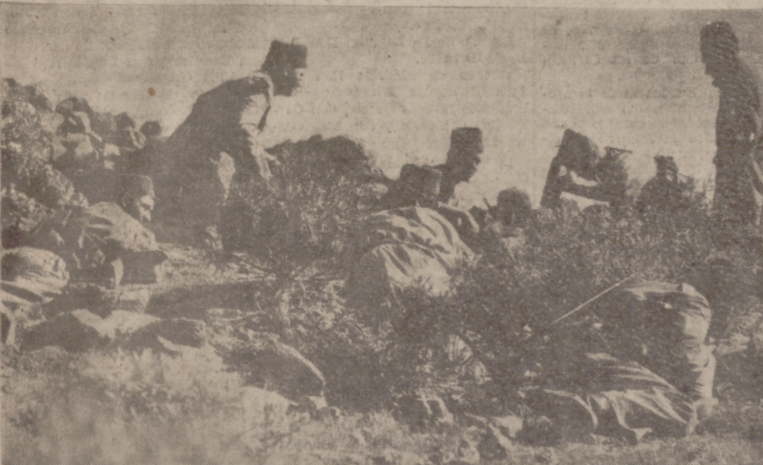
El fotógrafo llegó junto a esta sección de Tiradores de Ifni, en la primera línea del frente, donde captó con el "tele" este primer plano de acción.