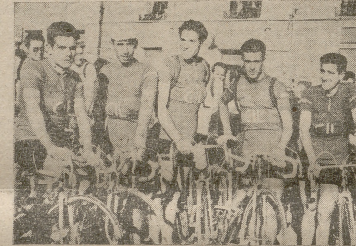
El equipo Gil-Indaucha, que tan brillante actuación tuvo en esta carrera, posa para Carrajal, antes de tomar la salida.

GERARDO SAN MAMES. Especialidad en vinos claretes del país. Se sirven meriendas. PASEO FARNESIO, 17 - Teléfono 6342